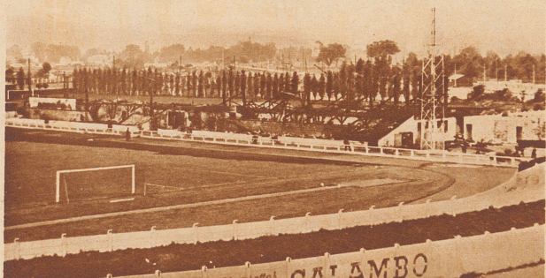
Die schönste Sportplatztribüne der Schweiz abgebrannt. In der Nacht vom 16. zum 17. Mai ist die 100 m lange und 20 m tiefe, 3000 Personen fassende Zuschauertribüne auf dem Zürcher Grasshoppers-Fußballplatz mit allen Nebenanlagen: Toiletten, Abwartwohnung, Klubrestaurant und Mobiliar vollständig abgebrannt. Der Schaden beträgt 300 000 Franken. Bild: Blick auf die Ruinen.