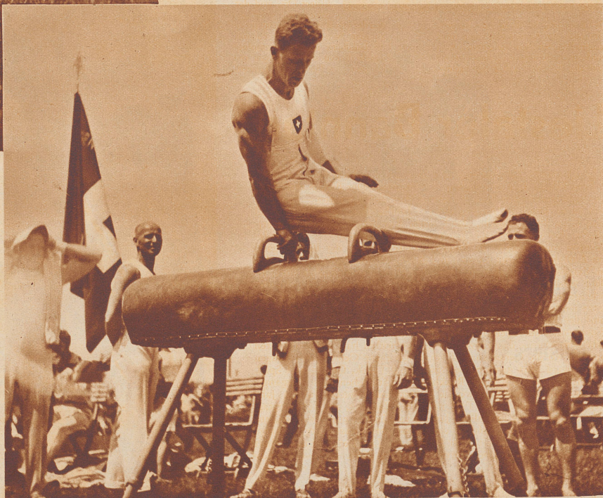
Eugen Mack, Basel, bei der Arbeit am Pferdpauschen. Mack errang am Barren, im Pferdsprung und Pferdpauschen die höchste Punktzahl. Mit 138,50 Punkten wurde er Weltmeister im Einzelklassement.