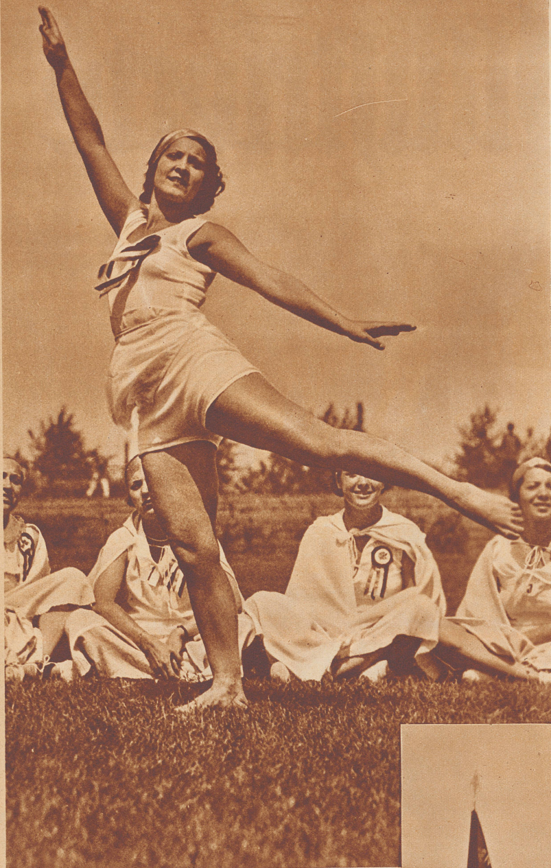
Frankreich, Tschechoslowakei und Ungarn stellten zu den Wettübungen je eine Damengruppe. Bild: Die Führerin des französischen Teams vor dem Photographen.