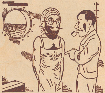
Ferienreise zur See

Immer im Beruf. Der Theaterdirektor war vom Astronomen auf die Sternwarte eingeladen worden, um sich eine Mondfinsternis anzusehen. «Wunderbar», sagte er zum Schluß, «und was mir besonders imponiert, das ist die Pünktlichkeit, mit der Ihr Personal so eine Sache inszeniert.»