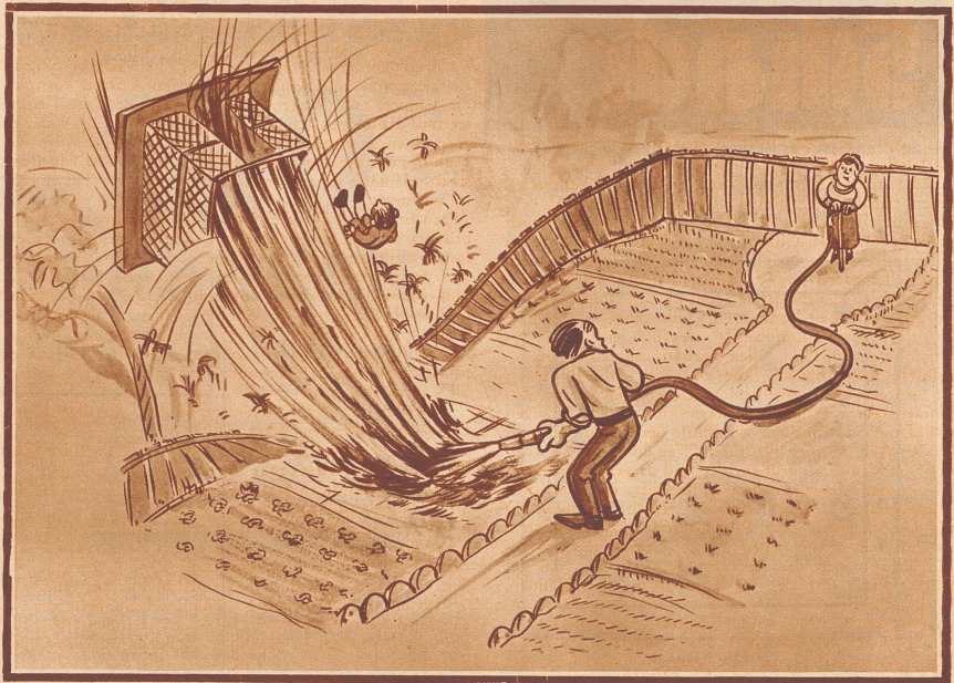
Sturm im Wochenend-Haus

«Langsam aufdrehen habe ich doch gesagt, Lina!»