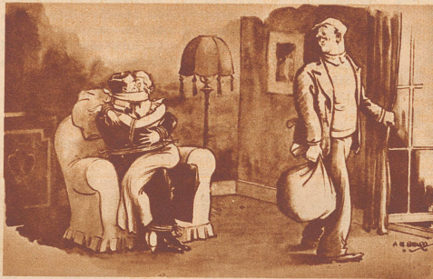
Der gefühlvolle Einbrecher

«So! . . . Ich hätte euch ja einzeln fesseln können, aber ich bin auch einmal jung gewesen!»