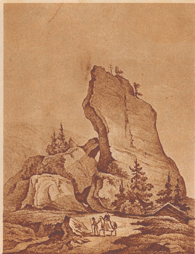
Das malerische Felsentor (beim Hotel Felsentor auf Route 28) nach einer alten Lithographie.