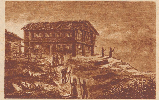
Das erste Hotel auf Rigi Kulm 1830.

Moden pflegen launisch zu sein. Die Rigmode, die zeitweise zu einem wahren Kultus ausgeartet war, flaute ab und wandte sich an anderen Gebieten zu. Es wurde stiller dort oben. Der Krieg kam, die Menschen wurden vernünftiger, selbständiger, natürlicher und begannen wieder zu wandern und Sport zu treiben. Auf den Righöhen begann neues Leben. Nicht mehr, weil die und die Höheit auch