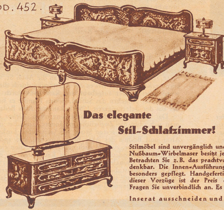
Das elegante Stil-Schlafzimmer!

Stilmöbel sind unvergänglich und haben bleibenden Wert. Dieses Stil-Schlafzimmer in feinstem Nußbaum-Wirbelmaser besitzt jene antike, warme Patina. Jedes einzelne Stück ist hochparat. Betrachten Sie z. B. das prachtvolle Bett (2 x 100/200 cm), elegantere Linien sind wohl kaum denkbar. Die Innen-Ausführung ist in goldfarbigem Vogelaugen-Ahorn, erstkl. poliert und besonders gepflegt. Handgefertigte Schnitzereien geben dem Raume vornehme Note. Trotz dieser Vorzüge ist der Preis dieses Stil-Schlafzimmers erstaunlich vorteilhaft. Fragen Sie unverbindlich an. Es lohnt sich!