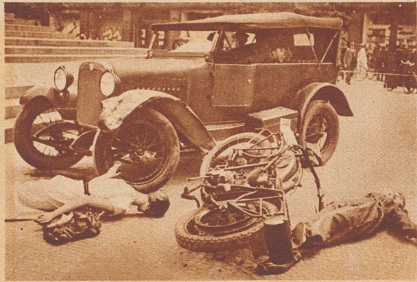
Erziehung zur Verkehrsdisziplin! In den Städten wächst der Verkehr von Jahr zu Jahr, nicht aber die Vorsicht der Stadtbewohner. Die Unfälle mehren sich trotz aller vorsorglichen Ratschläge. Nun sind die Verkehrspädagogen der Stadt Breslau auf ein neues Erziehungsmittel verfallen: auf das Grauen. Sie täuschen an einem bestimmten Tage am belebtesten Platz der Stadt durch Puppen einen Verkehrsunfall vor und hoffen durch dieses abschreckende Mittel den Bewohnern die Wichtigkeit einer strikten Verkehrsdisziplin erfolgreich verdeutlicht zu haben.