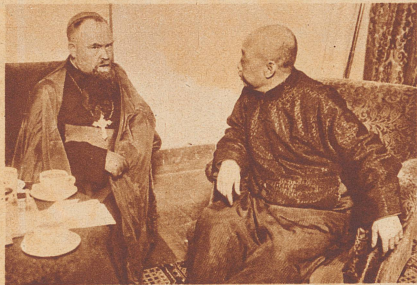
Der Vatikan wahrt seine Interessen in der Mandchurei. Die umsichtige und in die entlegensten Gebiete ausgreifende Organisation der katholischen Kirche bekundet sich in der Tatsache, daß der Papst einen Spezialgesandten nach Mandschukuo, das vor kurzem erst entstandene mandschurische Kaiserreich, schickte. Der Bevollmächtigte des Vatikans hat die Aufgabe, die durch die Abtrennung der Missionen von China neugeschaffene Lage abzuklären. Bild: Der päpstliche Gesandte Bischof Gaspais beim Außenminister des mandschurischen Reiches.