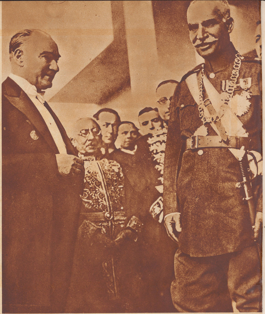
Der Schah von Persien besucht Kemal Pascha In Ankara ist zu wichtigen politischen und wirtschaftlichen Besprechungen der Schah von Persien eingetroffen. Es ist die erste Auslandsreise, die er seit seinem Regierungsantritt unternimmt. Die beiden Staatsoberhäupter Kemal Pascha (links) und Riza Khan Pahlavi (rechts) auf dem Bahnhof von Ankara.