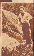
Der 70 Meter hohe Berg ist bestiegen. Man sieht sich ab zu