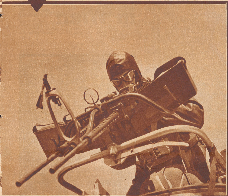
Die Beobachter-Schießkonkurrenz. Der Beobachter schießt mit einem Doppelmashinengewehr schweizerischer Konstruktion, das auf einem drehbaren Ring montiert ist. Die Bedienung des Maschinengewehrs erfordert große Geschicklichkeit und Körperkraft. Er schießt aus 50-100 Meter Höhe auf einen 4x10 Meter großen Tuchstreifen, der am Boden ausgebreitet ist.

Druck und Verlag: Conzett & Huber Zürich und Genf