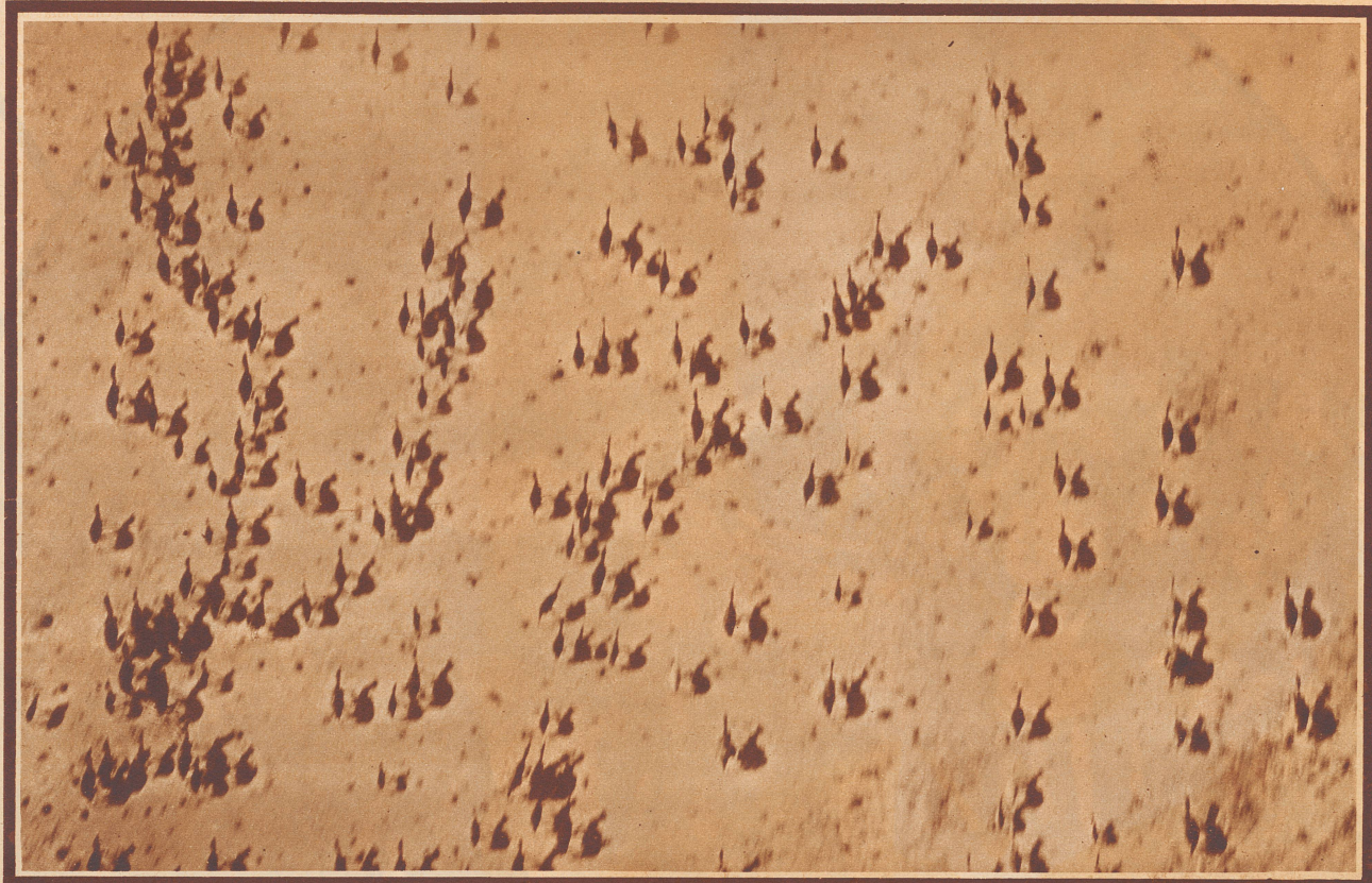
Kamele auf der Flucht bei einem Bombenangriff italienischer Flugzeuge auf eine Eingeborenen-Gruppe bei Hon in Tripolitanien. In dem Feldzug, den die Italiener zur Befriedung des Hinterlandes von Tripolitanien und der Cyrenaika unternommen haben, kam es vor, daß ganze Kamelherden durch Bombenangriffe vernichtet oder abgetrieben wurden. Die Angreifer sahen darin das wirksamste Mittel, die noch freien Eingeborenenstämme in ihrer Beweglichkeit zu hindern, ihnen möglichst großen Schaden zuzufügen und sie so in kürzester Zeit zur Unterwerfung zu zwingen. Denn: raubt man diesen Bewohnern der Sahara ihre Kamele, die für sie nicht nur Transportier und Lebensmittelpender, sondern auch Handelsobjekte bedeuten, so sind sie dem sichern Verderben geweiht.