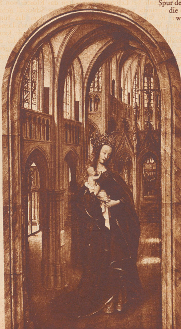
Der van Eyck für 30 Rappen

In Belgien vollzog sich vor einiger Zeit das jüngste Gaunerstück auf dem Gebiete der berühmten Bilderdiebstähle. In der Kathedrale von St. Bavo in Gent wurde am 11. April ein Flügel des berühmten Altargemäldes des van Eyck von bis jetzt unbekannt gebliebener Täterschaft geraubt. Es handelt sich dabei um ein Flügelstück des großen Altarwerkes, das auf der Seite die gemalte Statue Johannes des Täufers, auf der Rückseite die Gruppe der Gerechten Richter trägt. Der Kunsthandel, in den auf unbegreifliche Weise große Teile des Genter Altars gekommen waren, hatte die Flügel sorgsam zersägt, so daß der Johannes und die Gerechten Richter als Tafeln für sich dastanden. So kamen sie nach Berlin und waren dort im Kaiser-Friedrich-Museum ausgestellt. Bei Friedensschluß nach dem großen Kriege kehrten die beiden Bilder als Kriegstribut nach Belgien zurück. In der Kathedrale von Gent setzte man das einst Auseinandergesägte wieder zusammen, um den Altar wieder so in Ordnung zu bringen, wie er einst aus der Werkstatt Jan van Eycks hervorgegangen war. So kam es, daß die Diebe gleich zwei Bilder miteinander entwenden konnten. Trotz minutiöser Nachforschungen der internationalen Polizei konnte bis jetzt nicht die winzigste Andeutung von einer Spur der Räuber entdeckt werden. Was der oder die Uebelthäter mit dem Raube anfangen wollen, ist allerdings schwer begrifflich.