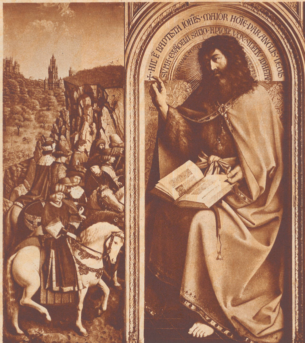
Der Diebstahl zu St. Bavo in Gent

In Belgien vollzog sich vor einiger Zeit das jüngste Gaunerstück auf dem Gebiete der berühmten Bilderdiebstähle. In der Kathedrale von St. Bavo in Gent wurde am 11. April ein Flügel des berühmten Altargemäldes des van Eyck von bis jetzt unbekannt gebliebener Täterschaft geraubt. Es handelt sich dabei um ein Flügelstück des großen Altarwerkes, das auf der Seite die gemalte Statue Johannes des Täufers, auf der Rückseite die Gruppe der Gerechten Richter trägt. Der Kunsthandel, in den auf unbegreifliche Weise große Teile des Genter Altars gekommen waren, hatte die Flügel sorgsam zersägt, so daß der Johannes und die Gerechten Richter als Tafeln für sich dastanden. So kamen sie nach Berlin und waren dort im Kaiser-Friedrich-Museum ausgestellt. Bei Friedensschluß nach dem großen Kriege kehrten die beiden Bilder als Kriegstribut nach Belgien zurück. In der Kathedrale von Gent setzte man das einst Auseinandergesägte wieder zusammen, um den Altar wieder so in Ordnung zu bringen, wie er einst aus der Werkstatt Jan van Eycks hervorgegangen war. So kam es, daß die Diebe gleich zwei Bilder miteinander entwenden konnten. Trotz minutiöser Nachforschungen der internationalen Polizei konnte bis jetzt nicht die winzigste Andeutung von einer Spur der Räuber entdeckt werden. Was der oder die Uebelthäter mit dem Raube anfangen wollen, ist allerdings schwer begrifflich.