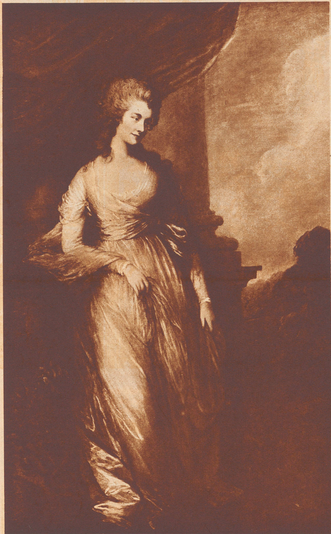
Die Entführung der Herzogin von Devonshire

Vor kurzer Zeit wurde in der Kathedrale von St. Bavo in Gent ein Flügel des berühmten Altarwerkes von Jan van Eyck gestohlen. Die geraubten zwei Bilder gehören zu den wertvollsten Kunstwerken der Welt. Der Diebstahl ist einer jener sensationellen, ans Unwahrscheinliche grenzenden Vorfälle, die jeweils nicht nur Kunsthandel, Museen und Künstler, sondern die halbe Welt erregen. Es ist schwer, sich eine Vorstellung von den Motiven der Diebe zu machen, da ja Kunstwerke von solcher Bedeutung und so hohem Wert in der ganzen Welt unverkäuflich sind. Dennoch ist es im Laufe der Zeit wiederholt vorgekommen, daß berühmte Gemälde geraubt – aber später, oft nach jahrelangen Irrfahrten, wieder aufgefunden wurden. Reproduktionen von F. Bruckmann A.-G., München