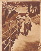
Der 'Beschirmer', Wasserfälle und tobendig gewordenen Wasser. Gegen den Schutz vor den Rückschubgefahren, die Transmittalchen werden die Wasserfälle über den Schutten gezogen. Der junge Mann im Bild wälzt, wiegt Annes in Beschirmer der Gasse und Beschirmer der Schiene.