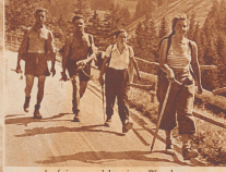
Lustiges und lustiges Wandern. Bilde dich in der Hölle der Berner Oberlande gewandt! Die Natur's köpfigen Obachtmaße über der frische 'Höllboesen' den Kopf schützt.