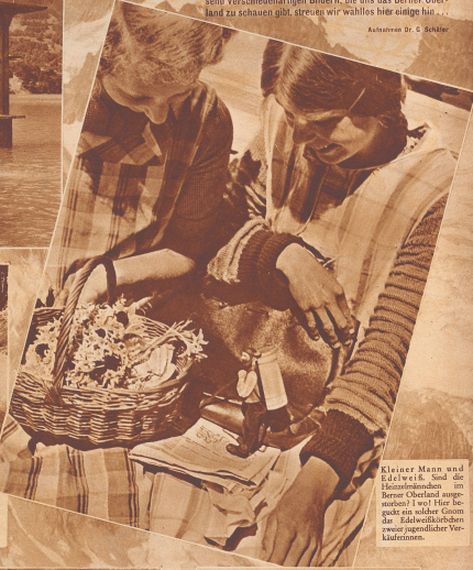
Kleiner Mann und E. L. 1. 1. 1. Sind die Hüttenwände im Berner Oberland ausgemauert? I wo Hütze begeben ein solches Gestein die Edelweißkörbechen, was ja eigentlich Vorläufer.