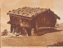
Das 'Vorabkischen', Zogel und in ähnlicher Weise sind der Teil des schönen Alpbassens. An den bewaldeten Ufern der Oberlander Seen finden wir noch völlig unberührte Vorabkischen.