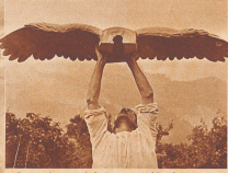
Der Briener-Schützer. Wir leben heute in den Zeiten der Spätglazial - Berner in dem Verkehrsnetz des Berner Oberlandes ein einwandriges Fortschrittsgeblänge verfügbar worden. - Was hat sollte mit dieser Briener Schützer nicht auch der Karawalle zugewandt haben?