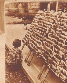
Ansichtskarten! Die Touristen kaufen sie, schreiben ihnen drauf, daß sie 'Das gewisse und, vertreten die Fortsetzung mit Souvenir und Ausreisepapieren und schicken die Bilder dann den armen Daberngebliebenen, zwecks Nostalgieweckung, denn das Wissen um die Beiseitwerden ist gesund und regert die Fernes-troste.