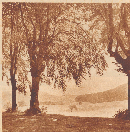
Wer dächte, daß diese rauschenden Buchen, inmitten einer sonnenstrahlenden Landschaft, den früheren Richtplatz des Landgerichts Konolfingen umrahmen!