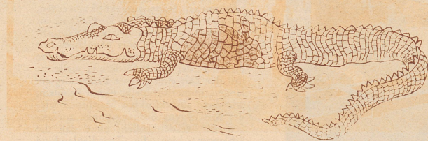
Was hat das Krokodil zu Mittag gespeist? Das habt ihr sicher herausgefunden. Nämlich ein Häschen.