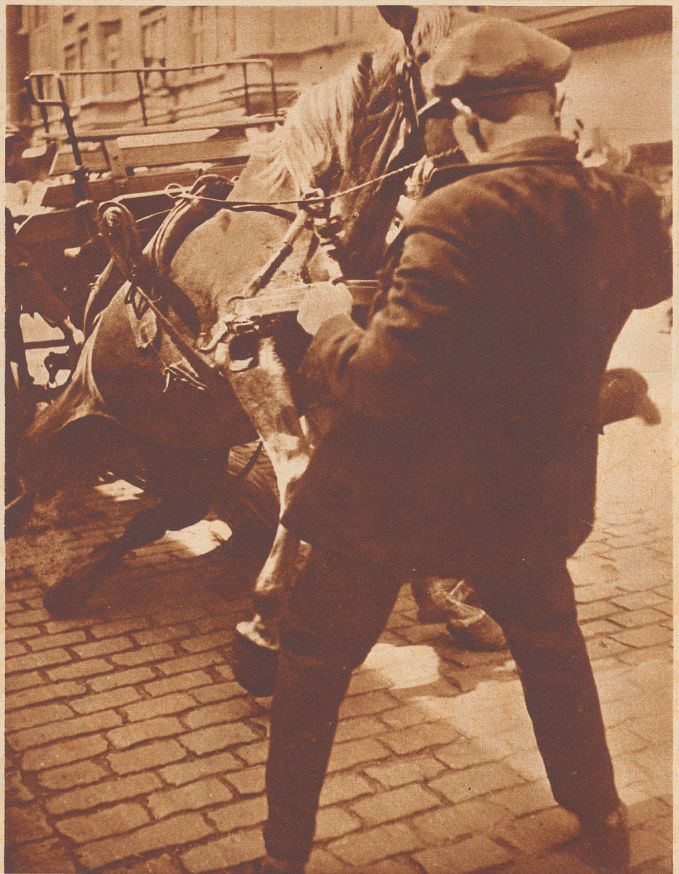
Mit vereinten Kräften gelingt es, den Hans auf die Beine zu bringen. Wer wohl mehr schwitzt, die Männer oder das Roß!

Kürzlich war am Mittag in der Stadt ein großer Menschaufmarsch. Der Ungle Redakter dachte, da sei ein Unglück geschehen und ist durch ein Hintergäßchen nach Hause gegangen. Das Zusehen, wenn auf der Straße etwas geschieht, überläßt er andern Leuten. Am Nachmittag ist dann ein Photograph in die Redaktion gekommen und hat Photos gezeigt, auf denen die Ursache dieses Menschaufmarsches zu sehen war. Ein Pferd, das einen Wagen zog, war ausgeglitten und zu Boden gestürzt... Da lag es nun, in Lederriemen und Ketten des Pferdegeschirrs verwickelt, auf dem Steinpflaster, konnte sich nicht bewegen und schnaufte und zitterte. Man konnte sehen, wie sehr sein Herz klopfte, und seine Augen blickten erschrocken und traurig. Der Fuhrmann selber sprang auch ganz erschreckt vom Wagen und glaubte, das Pferd habe ein Bein gebrochen. Immer mehr Leute kamen herbei und versuchten Ratschläge zu geben. Ihnen allen tat das Roß leid. Der Fuhrmann begann ganz sorgfältig Riemen und Schnallen zu lösen, um die Deichsel, welche immer die größte Gefahr für gestürzte Pferde ist, zu entfernen. Nun würde es sich zeigen, ob es beim Sturze etwa ein Bein gebrochen hatte. Nein, sobald Deichsel, Riemen und Ketten, in denen es sich verwickelt hatte, weg waren, versuchte es ganz allein aufzustehen. Man sah dem Fuhrmann an, wie froh er war. Unterdessen war auch ein Polizist herbeigekommen und gemeinsam versuchten die Männer nun das Tier auf