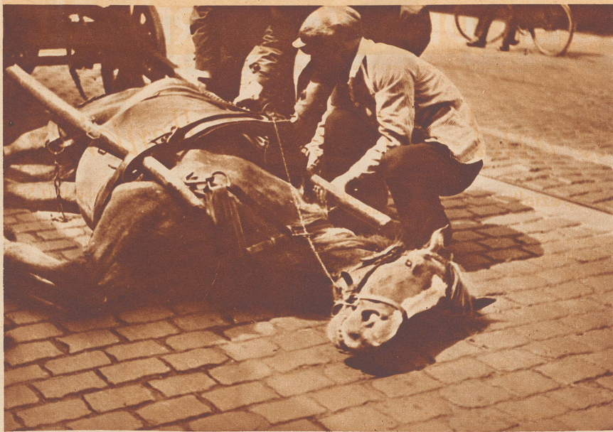
Sofort nach dem Sturz wird das Roß von den Deichseln befreit. «Wenn sie dem «Hans» nur keine Rippen eingedrückt haben», sagt der Fuhrmann voll Angst.

die Beine zu stellen. Das dauerte eine Weile, denn beim Aufstehen glitschte das Roß wieder von neuem aus. Nur mit Hilfe der Männer vermochte es sich endlich auf den Beinen zu halten. Schaum hing ihm aus dem Maul und noch immer zitterte es. Aber auch die Leute, die herumstanden, waren ganz aufgeregt und voll Mitleid. Eine Frau brachte Zucker herbei, und Leute, die wahrscheinlich noch nie in ihrem Leben mit Pferden zu tun hatten, streichelten es. Endlich nach langer Zeit stieg der Fuhrmann auf den Bock und ganz langsam setzte sich das Pferd in Bewegung.