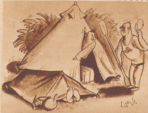
L. M. B.

Ein junger Mann prahlte mit seinen Vorfahren. «Womöglich wollen Sie uns erzählen, daß Ihre Ahnen in der Arche Noah mitfuhren?» «Kommt gar nicht in Frage. Meine Leute hatten ihr eigenes Boot.»