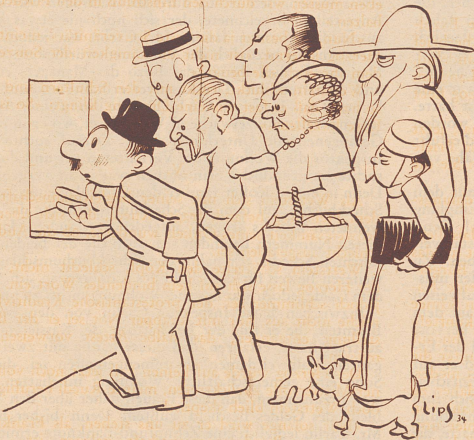
Zeichnung von R. Lips

«Bitte zweihundert Postkarten.» «An diesem Schalter gibt es nur Verkauf in kleineren Mengen.» «Sie können mir sie ja auch einzeln geben.»