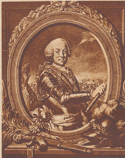
Der erste Träger des Maria-Theresia-Ordens, Graf Leopold Daun. Er bekam die Auszeichnung am 18. Juni 1757, am Tage der Schacht bei Kolin.

Wie merkwürdig ist nun angesichts dieses Beispiels, daß das selbe Oesterreich, das mit dieser Unerbittlichkeit das Herkommen und die Ueberlieferung zu verteidigen wußte, die einzigartige Einrichtung des Maria-Theresia-Ordens besaß. Die Kaiserin Maria Theresia gründete den Orden, nachdem einer der jüngeren Offiziere ihrer Armee einen Sieg «vorschriftswidrig» errungen hat. Weil er sich gegen die Disziplin verging, hätte er erschossen werden sollen. Weil er die Gesamtlage der kaiserlichen Armeen wesentlich verbessert hat, mußte er ausgezeichnet werden. Aus diesem Dilemma heraus entstand nun der Maria-Theresia-Orden, dessen Ritter nur solche Angehörige der Armee sein können, die einen Sieg heimbringen, indem sie sich gegen den höheren Befehl vergehen.