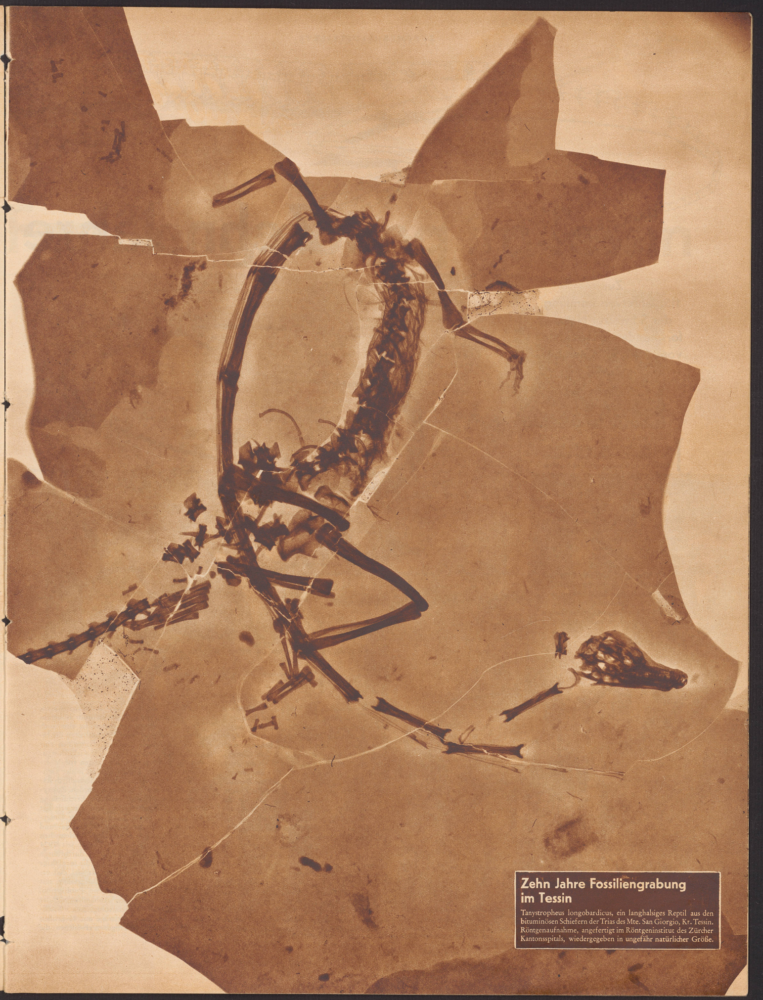
Zehn Jahre Fossilengrabung im Tessin Tanystropheus longobardicus, ein langhalsiges Reptil aus den bituminösen Schiefen der Trias des Mte. San Giorgio, Kr. Tessin. Röntgenaufnahme, angefertigt im Röntgeninstitut des Zürcher Kantonsspitals, wiedergegeben in ungefähr natürlicher Größe.