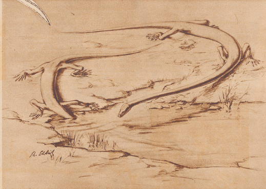
Lebensbild von Tanystrophia , entworfen auf Grund der Rekonstruktion.

Zur 115. Jahresversammlung der Schweizer Naturforschenden Gesellschaft vom 6. bis 9. September in Zürich