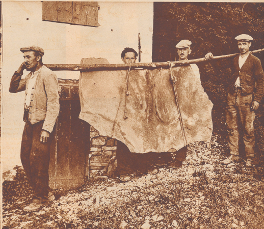
Tierreste eines großen Insekts, eines auf den reifen Pflanzstängel des Monte San Giorgio. Wie dieser Fund jetzt, nach erfolgter Behandlung und Heimarbeit aussehend, kann man, vom 12.-17. September im Zoologischen Museum in Zürich (Lindendurg 14) sehen. Dort sind die bisherigen Ergebnisse der Tessiner Fossilengrabung in einer temporären Ausstellung dem Publikum zugänglich gemacht.