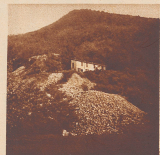
Der Stollen von Cava Tre Fontane am Monte San Giorgio, wo die bituminösen Schiefer bergmännisch abgebaut werden.