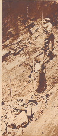
Arbeiten im Stollen des Zoologischen Museums der Universität Zürich bei der Fossilische in Beseno.