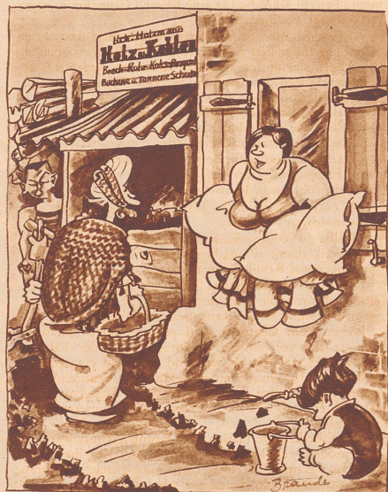
«Ihr Mann ist jetzt dem Feuerbestattungsverein beigetreten? — «Als Kohlenhändler konnte er doch nicht gut anders!» Zeichnung von Brandt

«Warum soll ich mich gegen Diebstahl versichern? Ich besitze ja nichts!» «Und die Frau Schwiegermutter, bei der Sie wohnen?» «Die stiehlt mir keiner!»