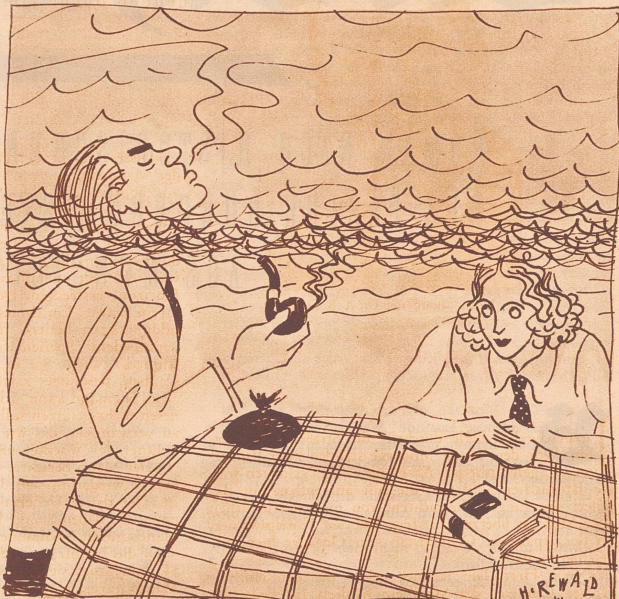
Ehezwit Zeichnung von H. Rewald

Der Seidenstoff. Inge betritt mit ihrem Großmütterchen das Seidengeschäft der kleinen Landstadt. Großmütterchen ist taub — so daß der Verkäufer (er ist zugleich der Inhaber) es wagt, liebenswürdige Aeußerungen zu tun. Inge hört nicht hin, sucht unter den Stoffen und fragt schließlich: «Was kostet diese erdbeerfarbene Seide? Ich brauche drei Meter.» Der Verkäufer: «Pro Meter einen Kuß.» Inge: «Gemacht.» Der Verkäufer: «O wie glücklich...» Inge: «Großmama zahlt...»