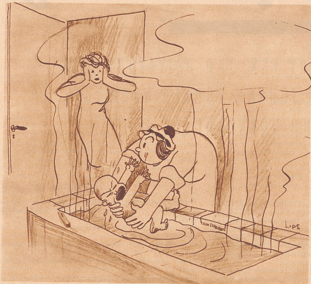
Madame: «Um Gottes willen, Mathilde, die Temperatur ist doch viel zu hoch für das Kind...!» Mädchen: «Mein Gott, was versteht denn so ein kleines Kind von der Temperatur!» Zeichnung von R. Lips