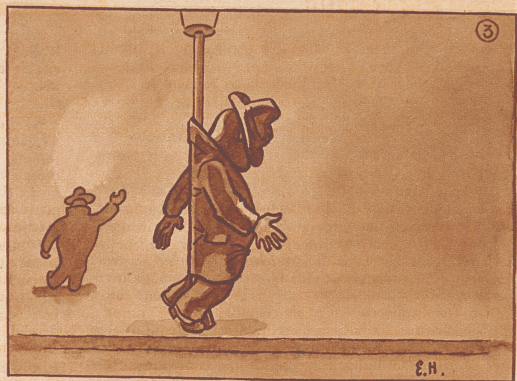
Wahre Begebenheit aus der Sauserzeit