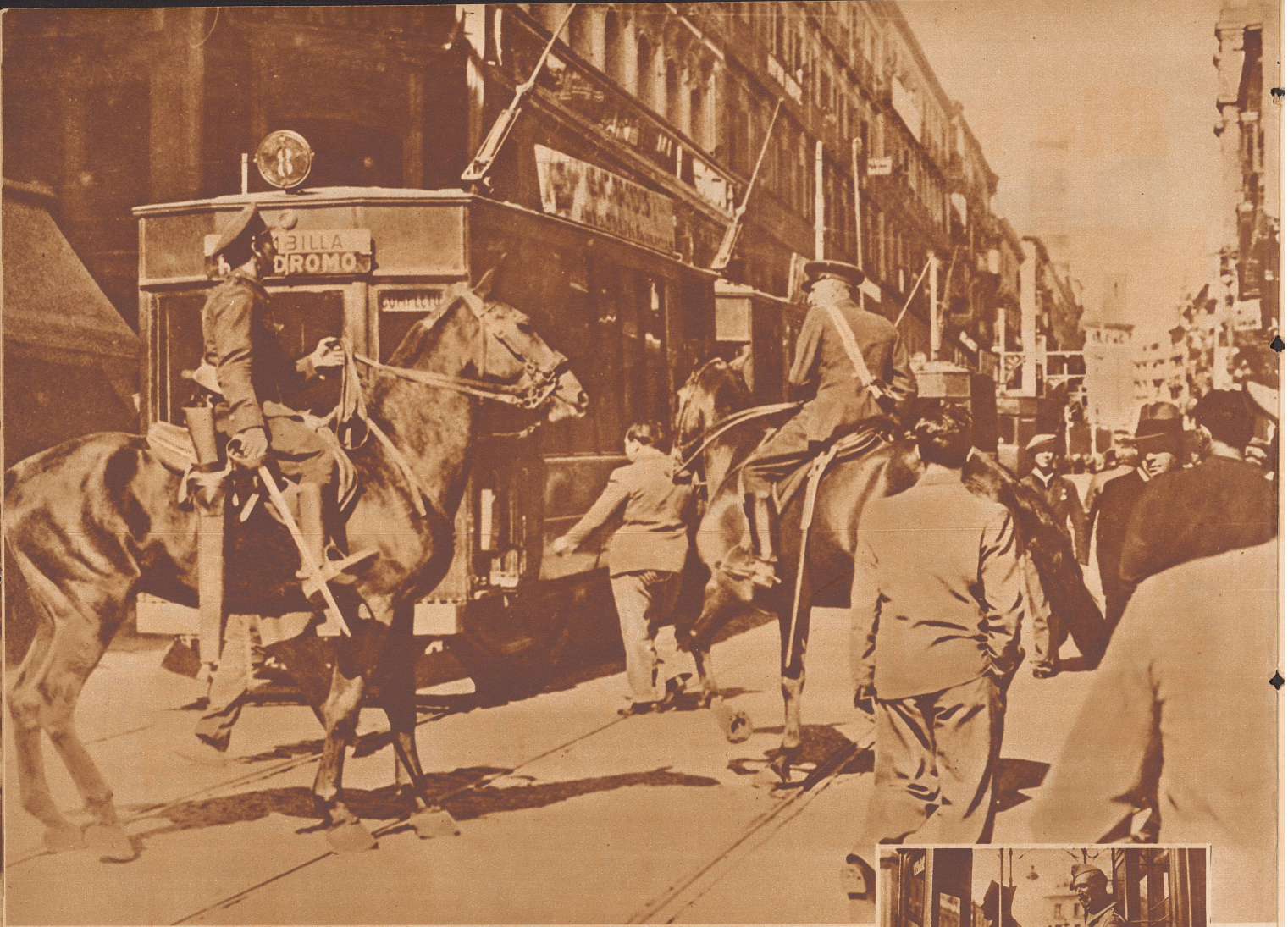
Madrid: Berittene Polizeieinheiten patrouillieren durch die Straßen, um die Ansammlung von Streikenden zu verhindern. Die Trambahnwagen, die in der Straße stehen, sind vom streikenden Personal auf der Strecke stehen gelassen worden.