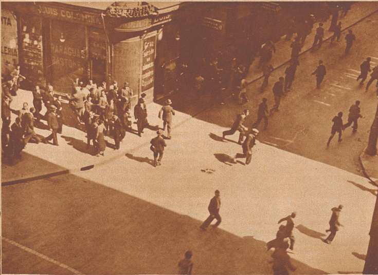
Madrid: An einer Straßenkreuzung angesammelte Streikende werden durch Gewehrfeuer der Polizei auseinandergetrieben.