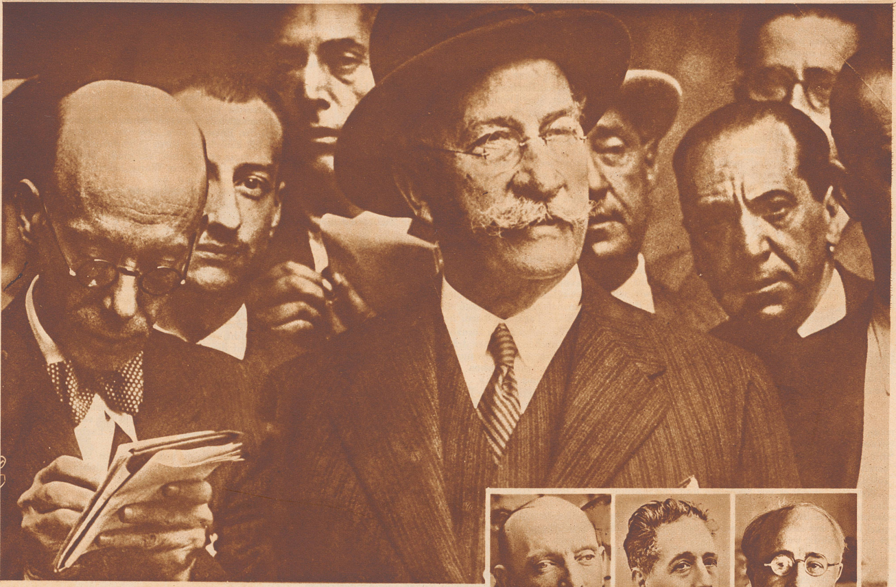
Ministerpräsident Alexandre Llerroux verläßt das Präsidentenpalais von Madrid.