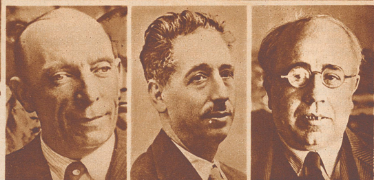
Ministerpräsident Samper. Das Ministerium Samper demissionierte am 1. Oktober. Ihm folgte darauf das Kabinett Lerroux, das Anlaß zur Auslösung des Generalstreiks gab.