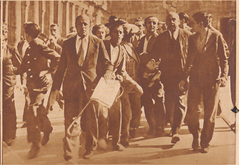
Madrid: Eine verirrte Kugel trifft einen harmlosen Spaziergänger. Man trägt ihn fort. Ein Hilfreicher (links) trägt Stock, Hut und Zeitung des Verwundeten.