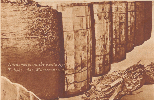
Nordamerikanische Kentucky-Tabake, das Würzmaterial.