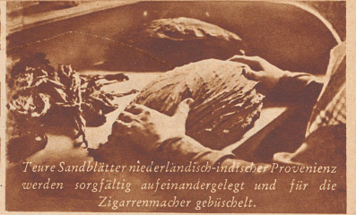
Teure Sandblätter niederländisch-indischer Provenienz werden sorgfältig aufeinandergelegt und für die Zigarrenmacher gebüschelt.

Sandblatt 10 Stück 70 Cts. VILLIGER SÖHNE A.G. · PFEFFIKON-REINACH