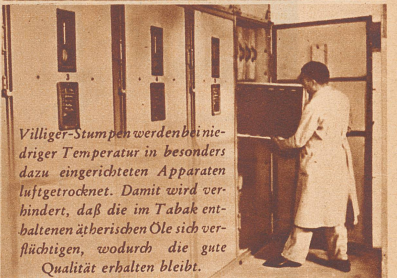
Villiger-Stumpfen werden bei niedriger Temperatur in besonders dazu eingerichteten Apparaten luftgetrocknet. Damit wird verhindert, daß die im Tabak enthaltenen ätherischen Öle sich verflüchtigen, wodurch die gute Qualität erhalten bleibt.