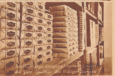
Reichlich lange, geeignete Lagerung fördert die gute Qualität der Villiger-Stumpfen