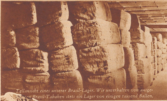
Teilansicht eines unserer Brasil-Lager. Wir unterhalten von ausgetrockneten Brasil-Tabaken stets ein Lager von einigen tausend Ballen.