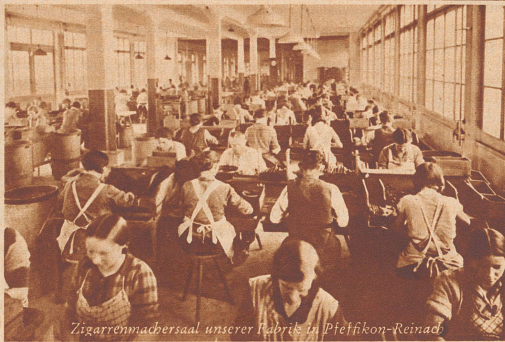
Zigarrenmachersaal unserer Fabrik in Pfeffikon-Reinach.