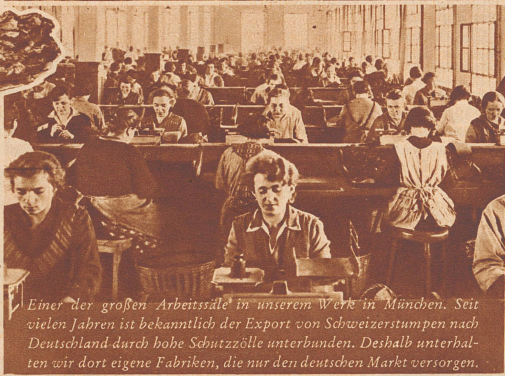
Einer der großen Arbeitsäle in unserem Werk in München. Seit vielen Jahren ist bekanntlich der Export von Schweizerstumpfen nach Deutschland durch hohe Schutzzölle unterbunden. Deshalb unterhalten wir dort eigene Fabriken, die nur den deutschen Markt versorgen.