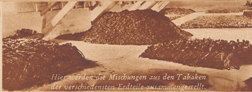
Hier werden die Mischungen aus den Tabaken der verschiedensten Erdteile zusammengestellt.