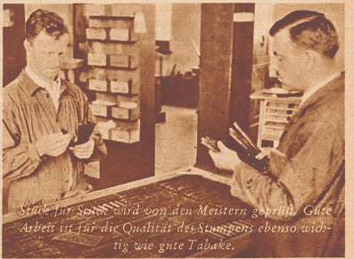
Stück für Stück wird von den Meistern geprüft. Gute Arbeit ist für die Qualität des Stumpfens ebenso wichtig wie gute Tabake.