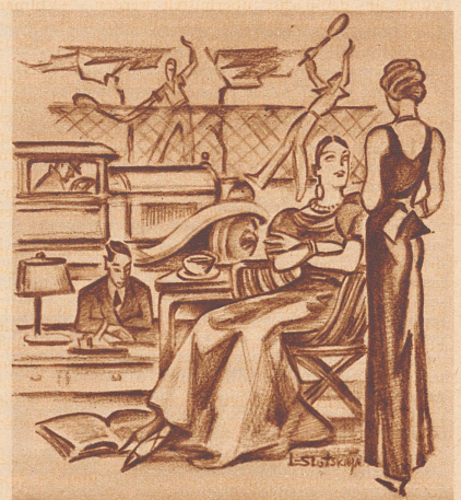
Gespräch unter Freundinnen.

«Nanu, was macht denn Ihre Frau da?» «Sie trainiert. Wir fahren nämlich nächste Woche nach Amerika und da probiert sie das beste Mittel gegen Seekrankheit aus!»