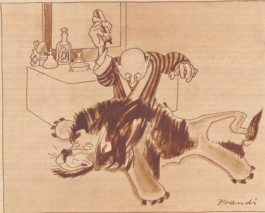
Ein wirklich wunderbares Haarwuchsmittel.

Sie: «Hör mal, hier steht, daß der englische König für zwei Millionen Franken Porzellan besitzt!» Er: «Hm — dann hat er wohl keine Hausangestellte?»