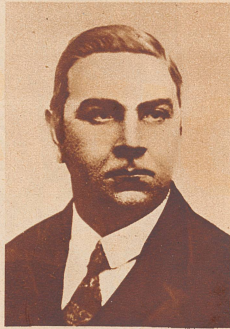
Dr. Ante Pawelitsch