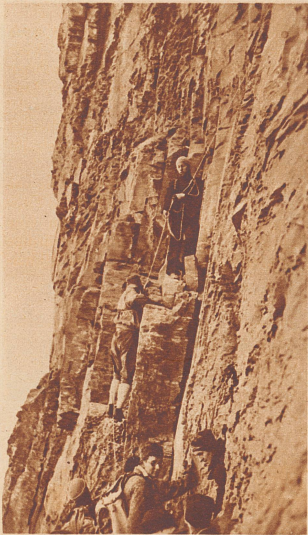
Kletterübung mit Seilsicherung an der «Wilden Frau»