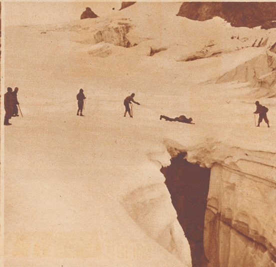
Das Ueberqueren einer zugeschnitten Gletscherspalte.

Anfangs Oktober vereinigte die Alpine Tourenwoche und Kletterschule des Pfadfinder-Alpenklubs eine stattliche Zahl älterer Pfadfinder aus England, Irland, Frankreich und der Schweiz in Kandersteg zur praktischen und theoretischen Einführung in den Alpinismus. Das Programm umfaßte neben einer Uebungstour auf die Fisistöcke (2949 Meter über Meer) Uebungen im Eis und Fels (Besteigung der «Wilden Frau», 3259 Meter über Meer) sowie Theorie über Wetterprognose, Orientierung im Nebel, alpine Unglücksfälle, Marschhygiene und sportliche Ausrüstung. Diese erste Tourenwoche verlief ohne den geringsten Unfall und soll im nächsten Jahr in ähnlicher Art mehrmals wiederholt werden.