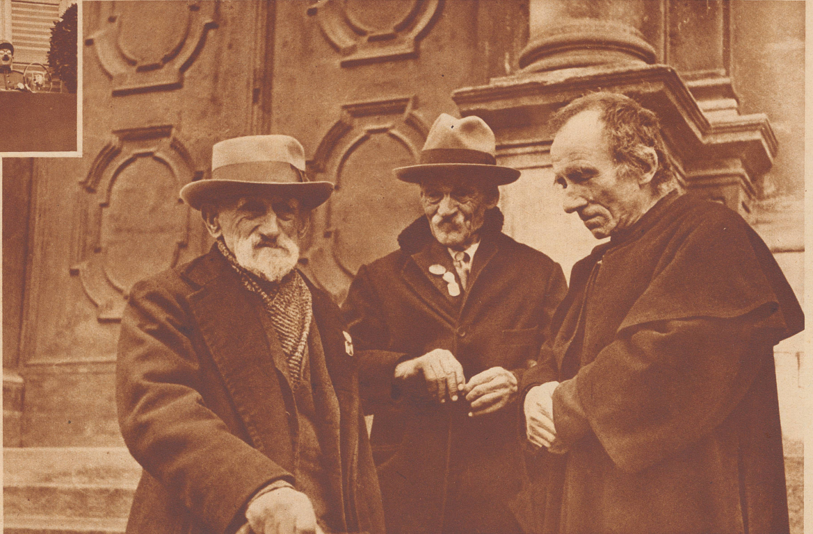
Drei Veteranen, alle über 80 Jahre alt, hören die Rede Bundesrat Mottas. Alle drei standen an der Grenze im Krieg von 1870-71.