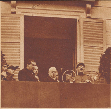
Am 4. November fand in Bellinzona eine Mobilisationsfeier der Tessiner Truppen statt. Bild: Oberstleutnant Vegezzi, Kommandant des Tessiner Regiments 30, spricht auf dem Balkon des Regierungsgebäudes zu den versammelten Truppen. Neben ihm Bundesrat Motta, der bei dem Anlaß selbst auch eine vielbeachtete Rede gehalten hat.