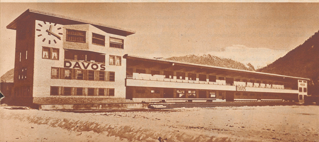
Der neue Eisbahn-Pavillon von Davos

Nachdem der Eisenbahnattentäter Sylvester Matuschka in Oesterreich seine Strafe abgessen hat, ist er jetzt an Ungarn ausgeliefert worden. Hier hat er sich wegen der schlimmsten seiner Missetaten zu verantworten: dem Anschlag auf einen Schnellzug, den er am 12. September 1931 auf dem Viadukt von Bia Torbagy zum Entgleisen brachte. Der Absturz des Zuges hatte den Tod von 22 Reisenden zur Folge. Bild: Matuschka bei den Verhandlungen im Budapestener Landesstraßenrichtshof.