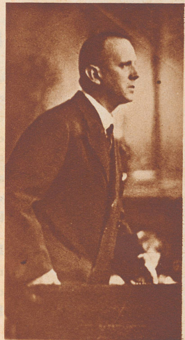
Matuschka vor den Richtern in Budapest

Nachdem der Eisenbahnattentäter Sylvester Matuschka in Oesterreich seine Strafe abgessen hat, ist er jetzt an Ungarn ausgeliefert worden. Hier hat er sich wegen der schlimmsten seiner Missetaten zu verantworten: dem Anschlag auf einen Schnellzug, den er am 12. September 1931 auf dem Viadukt von Bia Torbagy zum Entgleisen brachte. Der Absturz des Zuges hatte den Tod von 22 Reisenden zur Folge. Bild: Matuschka bei den Verhandlungen im Budapestener Landesstraßenrichtshof.