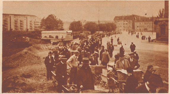
Die große Schlange der Wartenden. Mit Körben, Schachteln und Kisten und mit allen möglichen Fahrzeugen kommen die Arbeitslosen, um ihr Quantum Obst in Empfang zu nehmen.