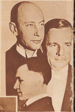
George R. Minot (oben) George H. Whipple (rechts) und William P. Murphy (unten), drei amerikanische Aerzte, teilen sich in den Medizin-Nobelpreis. Die drei Forscher verdanken die Auszeichnung einer höchst bedeutsamen Errungenschaft, an der sie alle in fast gleichem Ausmaße beteiligt sind; sie haben im abgelaufenen Jahrzehnt die Leberbehandlung der perniziösen Anämie begründet und durchgesetzt.