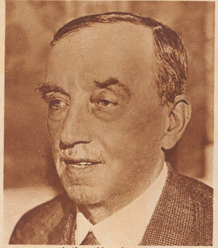
Arthur Henderson der Präsident der Abrüstungskonferenz, ist Gewinner des Friedens-Nobelpreises.