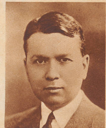
Professor Harold Clayton Urey von der Columbia-Universität in New York ist Chemie-Nobelpreisträger für 1934. Er hat sich den Preis durch seine Entdeckung des schweren Wasserstoffes verdient.