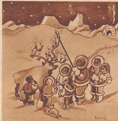
Stille Nacht bei den Eskimos.

Mutter: «Sag, Bübchen, wie gefällt dir Muttis neues seidenes Kleid?» Bübchen (begeistert): «Prachtvoll!» Mutter: «Und nun denke mal, alle diese Seide stammt von einem armen Wurm.» Bübchen: «Von Papi?»