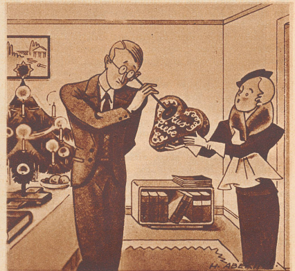
Der junge Mediziner erhält ein Lebkuchenherz geschenkt.

«Ganz recht. Gerade das hat ihn so beliebt gemacht.»