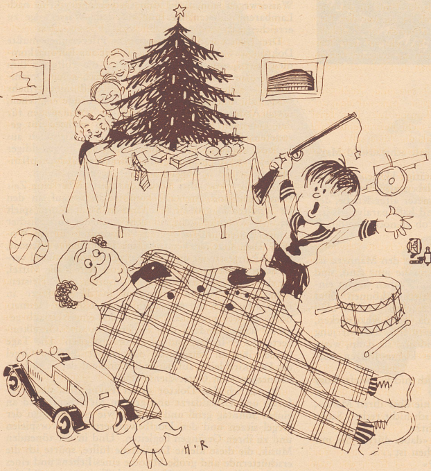
Onkel Edwards Weihnachtsfreude