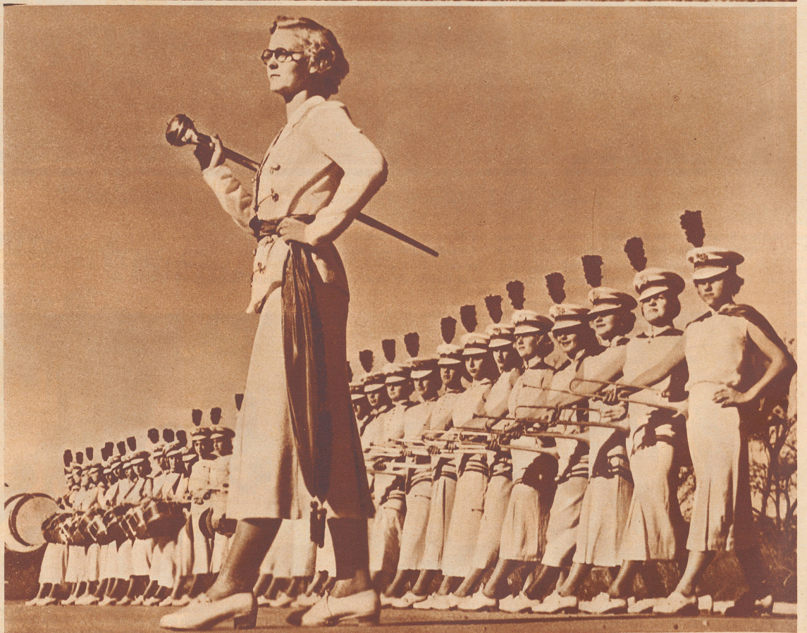
. . . . . des Trompeter- korps der Studentinnen von Canoga Park in U. S. A. Man behauptet, daß diese jungen Damen nicht nur forsch auf- treten, sondern nebenbei auch ganz erträgliche Musik machen könnten.