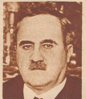
Prof. Dr. h. c. Max Huber der hervorragende schweizerische Rechtsgelehrte, feierte am 28. Dezember seinen 60. Geburtstag.

Der Südpolflug Lincoln Ellsworths. Dem bekannten Polarforscher Ellsworth gelang in der Weihnachtsnacht ein Direktflug über den antarktischen Kontinent. Ellsworth startete in Begleitung von Pilot Bernt Balchen in Snow Hill Island im Weddellmeer, überquerte in 20stündigem Flug den südpolaren Kontinent und landete wohlbehalten in Little Amerika am Roßmeer. Ellsworth hat früher mit Amundsen auch den Nordpol überflogen. Die beiden und der amerikanische Forscher Byrd sind die einzigen Menschen, die bis heute beide Pole gesehen haben. Der Flug Ellsworths über den Südpol war um so gefährlicher, als bei einer Notlandung in der unbekanntesten Inlandeiswüste der Antarktis keine Rettung möglich gewesen wäre. — Bild: Lincoln Ellsworth, der, nebenbei gesagt, Besitzer des Schlosses Lenzburg ist, auf seinem Expeditionsschiff «Wyatt Earp» bei der Ankunft in der Antarktis.