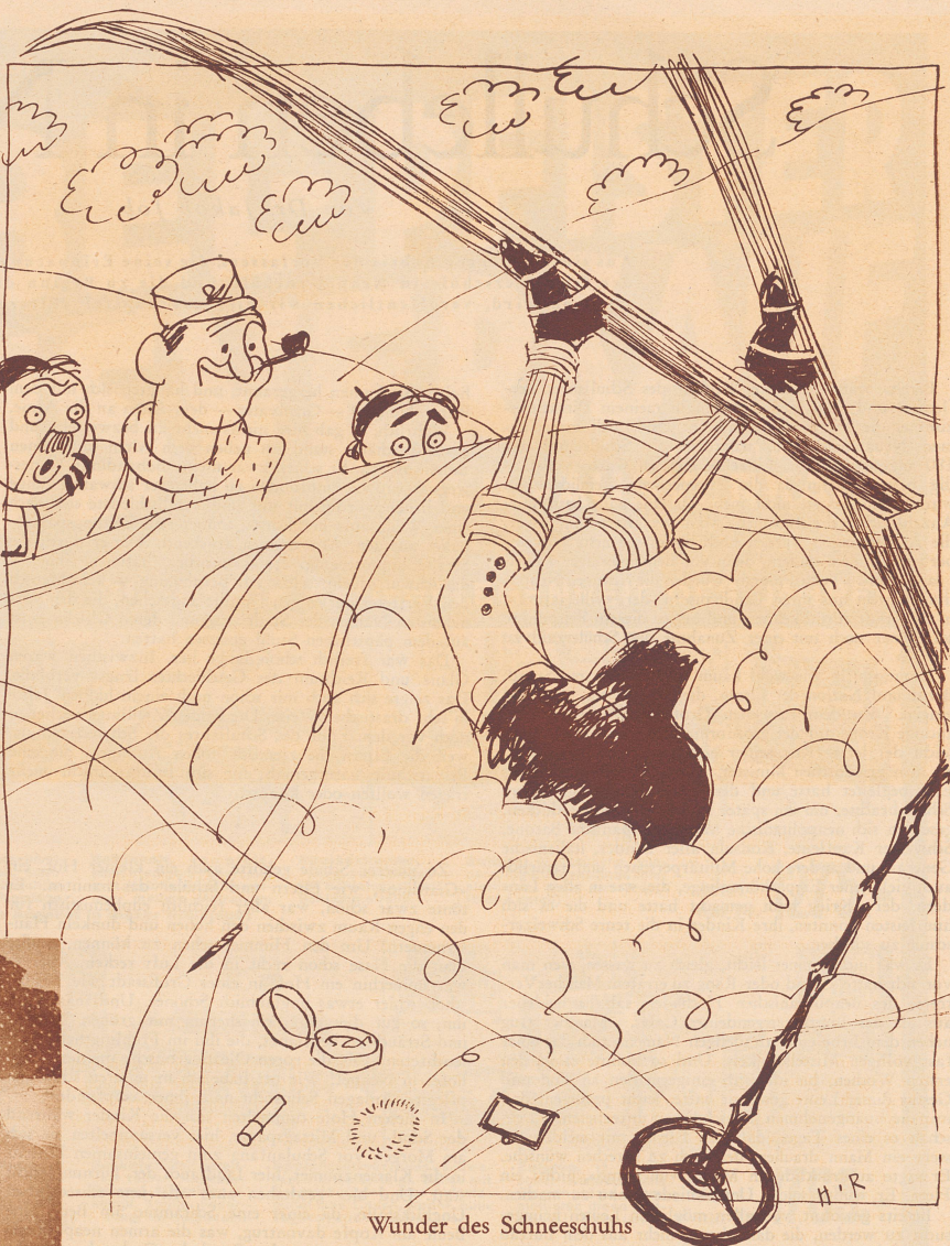
Wunder des Schneeschuhs

«Ich habe gehört, daß sich Ihre Tochter mit einem einfachen Buchhalter verlobt hat, Frau Remmel?» «Erlauben Sie mal, Frau Schwammerl! Meine Tochter verlobt sich nicht mit irgendeinem einfachen Buchhalter verlobt!»