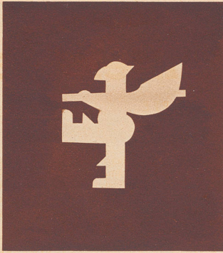
. . . und wie ihn die Schüler als Scherenschnitt wiedergaben.