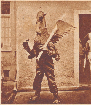
Der Vogel «Gryff», wie er durch Kleinbasels Straßen zieht . . .