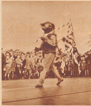
Der Wappenhalter der Gesellschaft zum «Rebhaus», der Löwe . . .