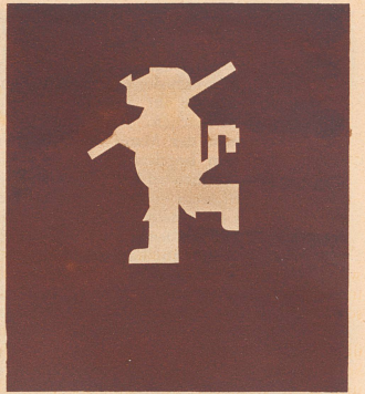
. . . und der Scherenschnitt des Wappentiers.