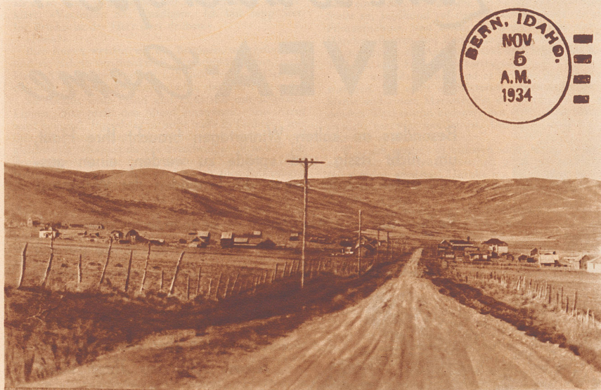
Die «Stadt» Bern in U. S. A.

«Dann kann ich ja gehen», sein Blick sucht immer auf