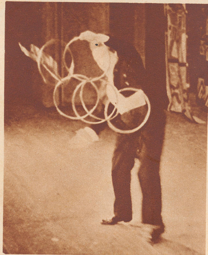
Verblüffend! Die Eisenringe hängen alle ineinander. Doch Cefalo löst und verbindet sie nach Belieben in raschster Folge, ohne sie je irgendwo abzusetzen oder abzulegen. Er läßt die Zuschauer probieren, doch gelingt es keinem; nicht ein einziger kommt hinter die Sache, und Cefalo gibt das Geheimnis um diese Dinge nicht preis.