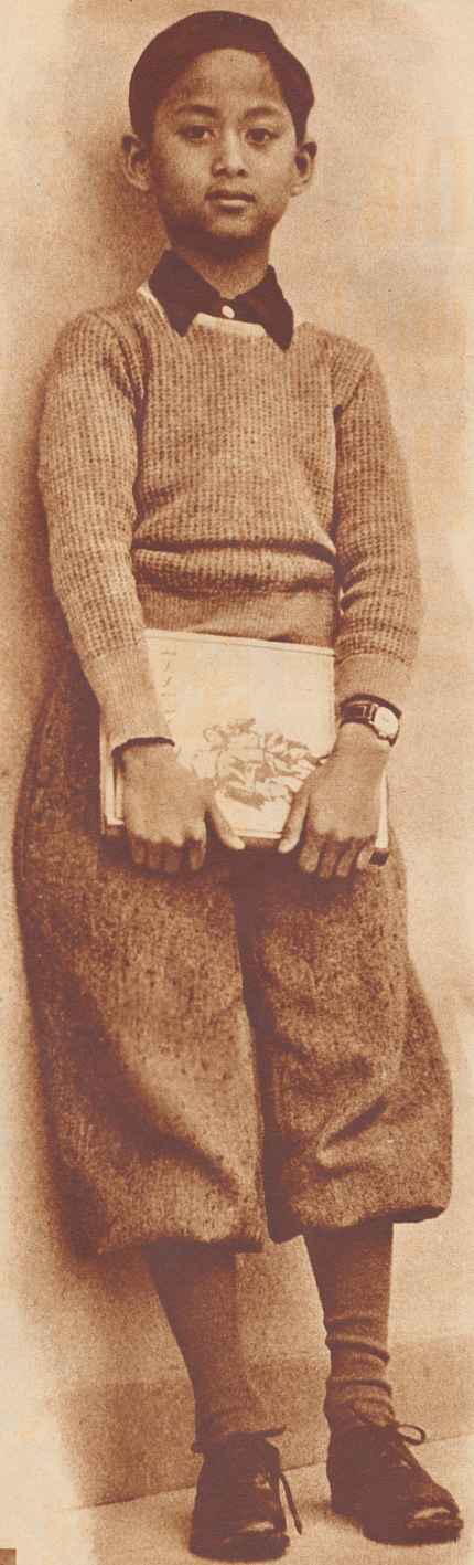
Der neue König von Siam, Ananda Mahidol. Er ist elf Jahre alt und wird in einer Privatschule in Lausanne erzogen.