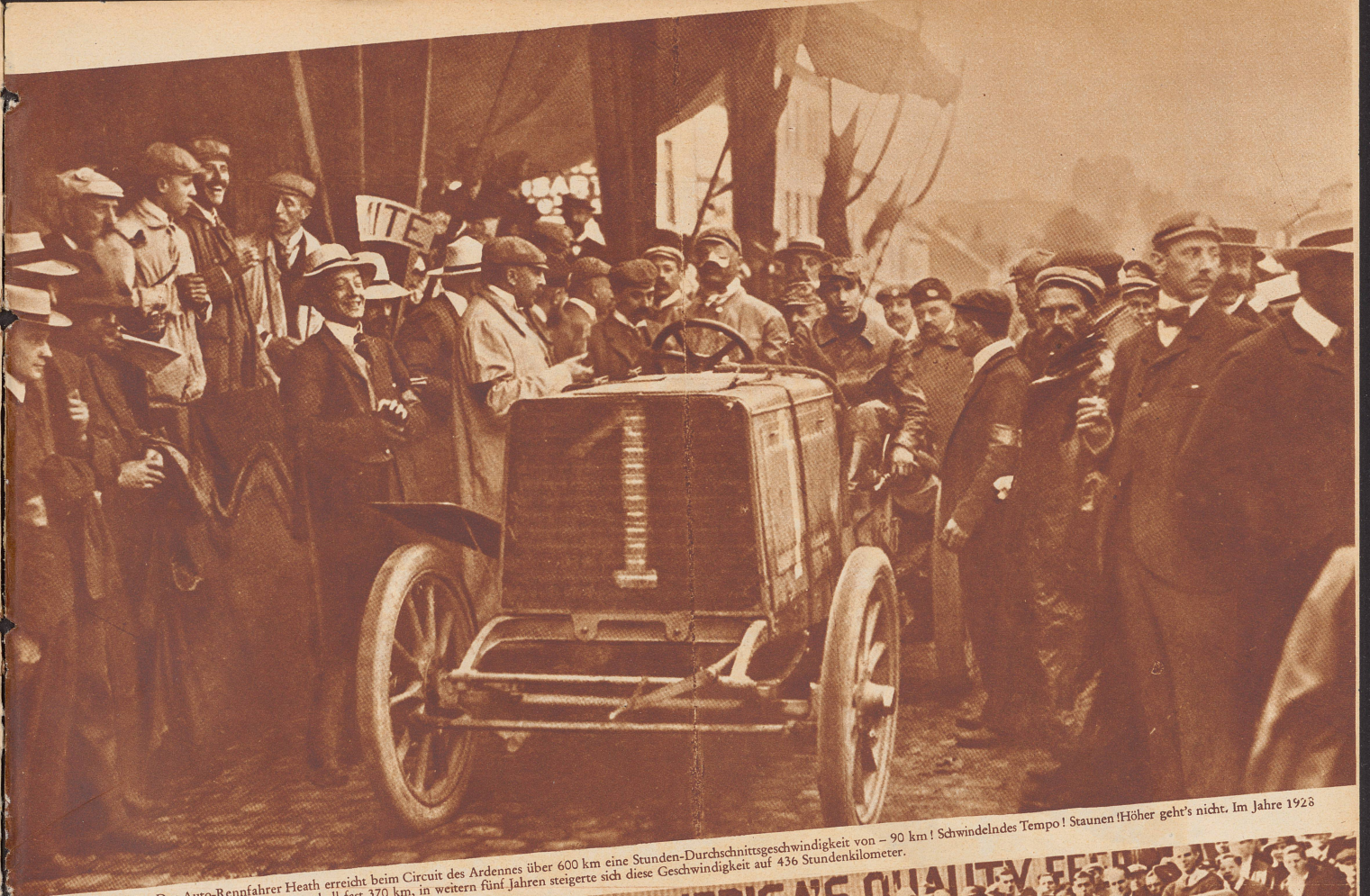
1904 Der Auto-Rennfahrer Heath erreicht beim Circuit des Ardennes über 600 km eine Stunden-Durchschnittsgeschwindigkeit von 90 km! Schwindelndes Tempo! Staunen! Höher geht's nicht. Im Jahre 1928 erreichte Sir Malcolm Campbell fast 370 km, in weitem fünf Jahren steigerte sich diese Geschwindigkeit auf 436 Stundenkilometer.