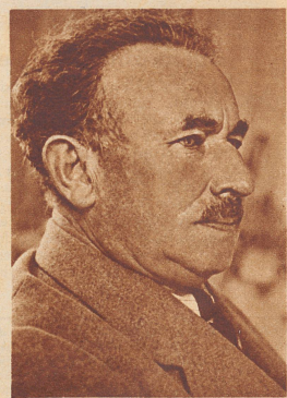
Paul Ilg der bekannte Schweizer Schriftsteller, beging am 14. März seinen 60. Geburtstag.