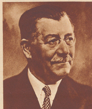
† Alt Nationalrat Ernst Schmidheiny

Luterbach, Präsident der kartellierten schweizerischen Zementfabriken. Seine militärische Laufbahn beendete er als Kommandant der Artilleriebrigade 2. Er stand im 62. Altersjahr.