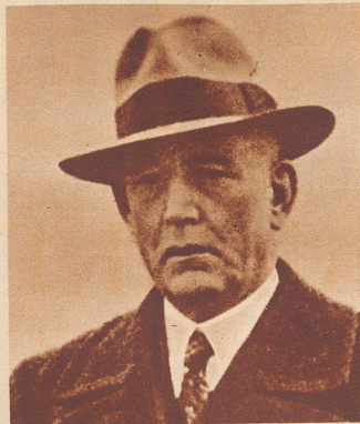
† Oberst Rudolf Frey

Luterbach, Präsident der kartellierten schweizerischen Zementfabriken. Seine militärische Laufbahn beendete er als Kommandant der Artilleriebrigade 2. Er stand im 62. Altersjahr.