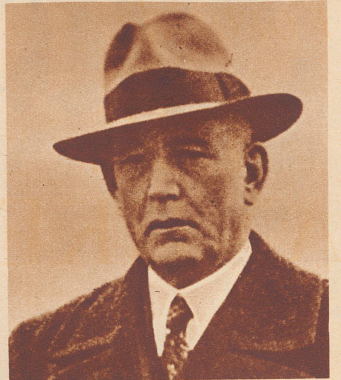
† Oberst Rudolf Frey

Luterbach, Präsident der kartellierten schweizerischen Zementfabriken. Seine militärische Laufbahn beendete er als Kommandant der Artilleriebrigade 2. Er stand im 62. Altersjahr.