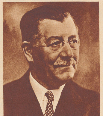
† Alt Nationalrat Ernst Schmidheiny

Luterbach, Präsident der kartellierten schweizerischen Zementfabriken. Seine militärische Laufbahn beendete er als Kommandant der Artilleriebrigade 2. Er stand im 62. Altersjahr.