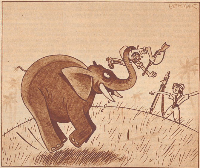
«— Rupp ihm ein Haar aus, Max, — — Elefantenhaare bedeuten Glück! —!»

Zwei stritten sich. «Einer von uns beiden lügt.» «Stimmt. Einer lügt.» «Ich weiß auch wer!» «Ich auch!»