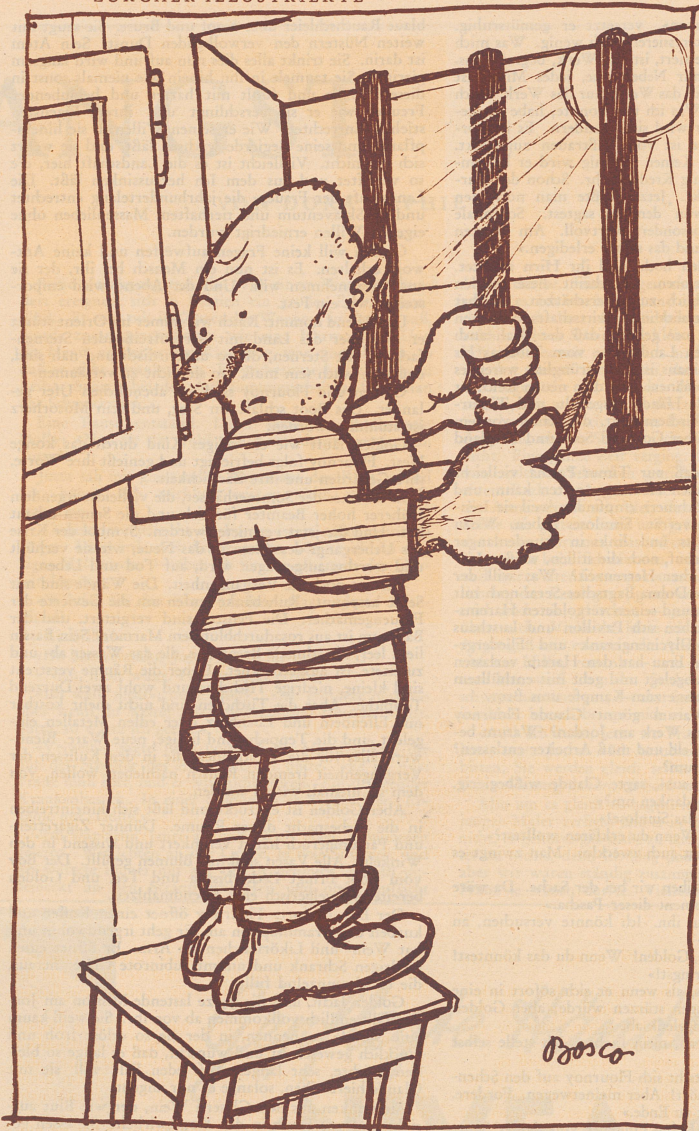
Frühlingserwachen. Das «Feilchen»

«O Gott, jetzt hab' ich den Strumpf verkehrtrum angezogen —!»