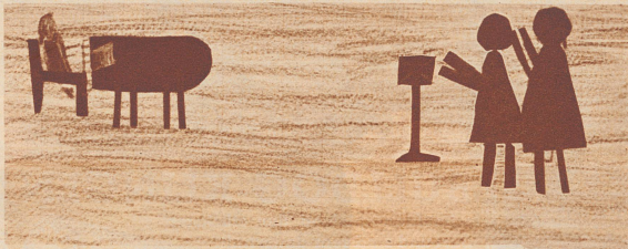
So sah es ungefähr im Radiostudio aus. Links ist der Flügel, und das kleine Kästchen, vor dem die beiden Mädchen stehen, das ist das Mikrophon, dieser kleine Apparat, in den man spricht.

Lieber Unggle Redakter! Ich bin schon drei mahl im Radio gewesen. Das letzte mahl habe ich auch etwas aufsagen können. Die Lehrerin hat eure Brieflein uns vorgelesen. Sie haben mir gut gefallen. Im Studio ist ein roter samet Teppich gewesen. Ich habe zu letzt noch auf gesagt. Ich habe von einem Mann eine grosse Tafel Schokolade bekommen.