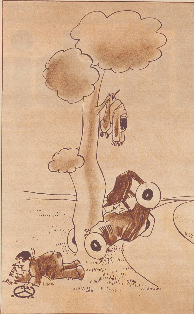
So ein Glück! -- Ein 4-blättriges Kleeblatt!