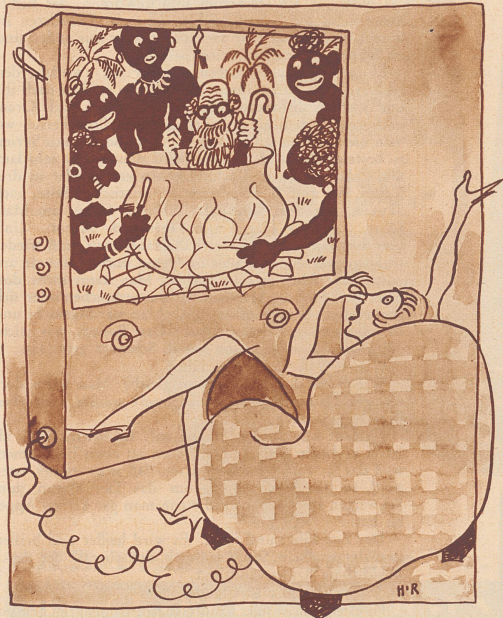
1938 - Fernrieher auf Welle Kamerun. «Um Gottes willen, die lassen den Kerl ja anbrennen -!»

«Und wieviel Lohn zahlen Sie mir?» «Ich werde Sie nach Ihren Leistungen bezahlen.» «Nein! Für so wenig habe ich noch nie gearbeitet.»