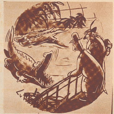
... daß meine Krokodil-Schuhe an der Spitze kaputt sind.

Ja oder nein. Frau Peck: «Heute vor fünf Jahren batest du mich, das eine kleine Wort zu sprechen, das dich fürs ganze Leben glücklich machen würde.» Herr Peck: «Ja, und - wie du immer bist - du sprachst gerade das falsche.»