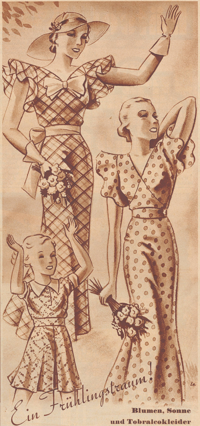
Blumen, Sonne und Tobralco Kleider

Sie finden jetzt in allen einschlägigen Geschäften die neuen Dessins für 1935. Preis Fr. 2.30 netto ohne Skonto (97 cm breit). Achten Sie auf die Schutzmarke Tobralco auf der Kante. Fertige Kleider aus Tobralco-Produkten tragen die Marke SCHERRER