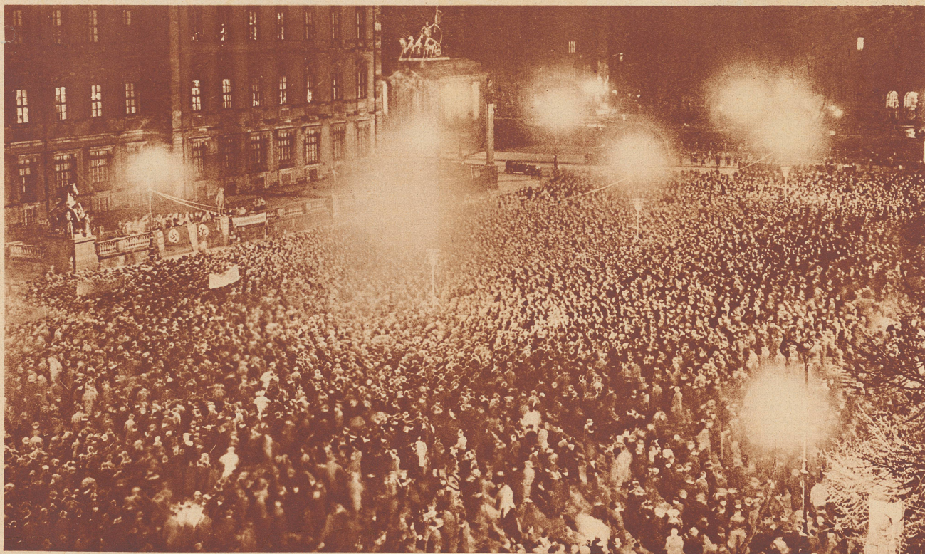
In Berlin: Riesenprotestversammlung am 27. März im Berliner Lustgarten. Dieser Protest richtet sich gegen das Urteil im Hochverrats- und Femenmordprozeß von Kowno (Litauen), bei welchem vier Memeldeutsche zum Tode, zwei zu lebenslänglichem Zuchthaus und zwanzig zu Zuchthausstrafen von 2 bis 12 Jahren verurteilt wurden. In zehn andern deutschen Großstädten fanden ebenso wuchtige Protestkundgebungen wie in Berlin statt.