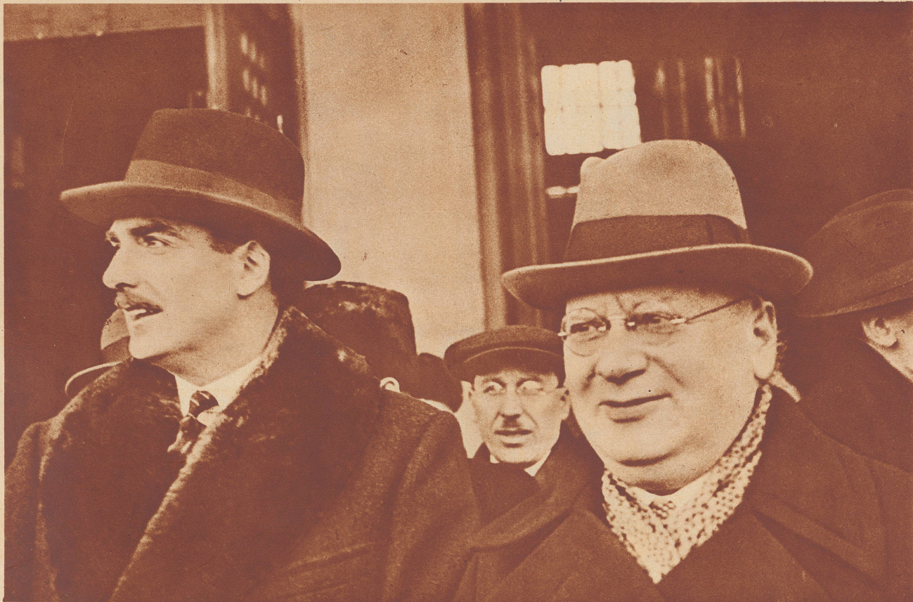
In Moskau: Sir Anthony Eden, der britische Lordsiegelbewahrer, ist am 28. März zu großen politischen Besprechungen in Moskau eingetroffen. Unser Bild zeigt ihn (links) mit dem russischen Volkskommissär Litwinow bei der Ankunft im Weißrussisch-Baltischen Bahnhof in Moskau.