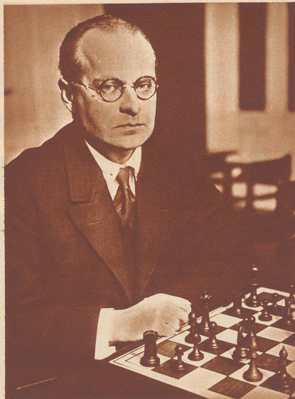
Großmeister A. Nimzowitsch starb 48jährig in Kopenhagen.

Nimzowitsch teilte den 1. und 2. Preis mit Rubinstein in Marienbad 1925, holte sich erste Preise in Dresden 1926, Nien-dorf und London 1927, in Berlin 1928 und in dem sehr stark besetzten Karlsbader Turnier 1929. Jetzt fanden seine Theorien Anerkennung und die Mitwelt, die ihn bisher verlacht hatte, pries ihn plötzlich als größten Strategen seiner Zeit. Allein bereits senkte sich die Kurve wieder. In San Remo wurde er 1930 Zweiter, in Veldes 1931 Dritter, und als er 1934 nach Zürich kam und erklärte, er sei nicht mehr der Alte, war dies klare Selbsterkenntnis und nicht etwa ein launenhafter, seinem pessimistischen Wesen entsprungener Ausspruch. Pessimist und Grübler blieb Nimzowitsch nämlich auch in den Jahren seiner besten Erfolge. Die schweren Enttäuschungen, die zahllosen Ungerechtigkeiten, die er in den Jahren seines mühsamen Aufstieges zu erdulden hatte, ließen sich nicht aus-wischen; sie zeigten immer und immer wieder ihren Nach-klang. Der Verkehr mit dem Großmeister war daher nicht