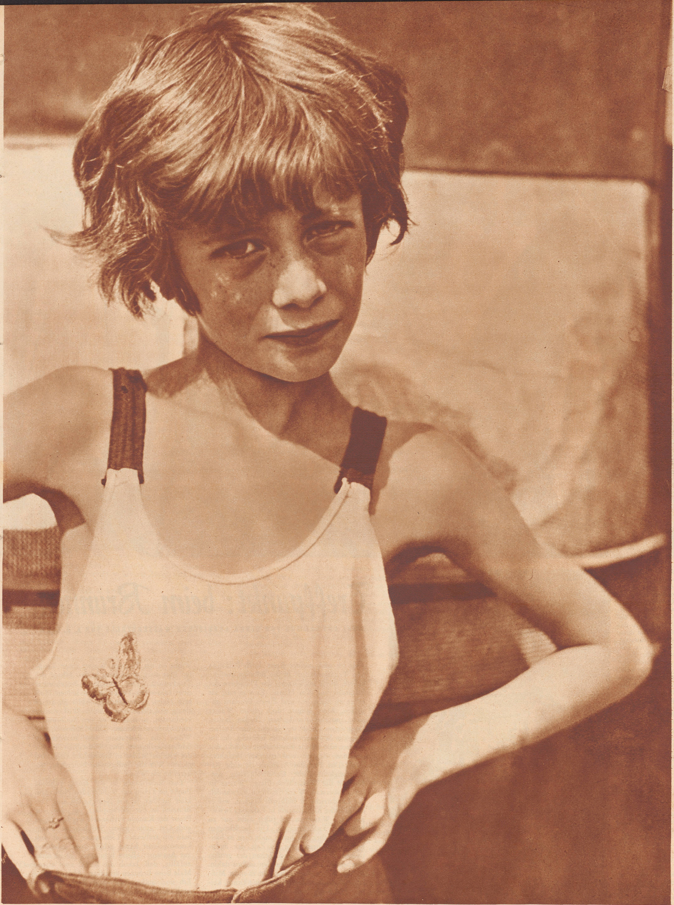
Ein Berliner Junge, der in einem großen Zirkus allabendlich einen Prolog sprechen muß.