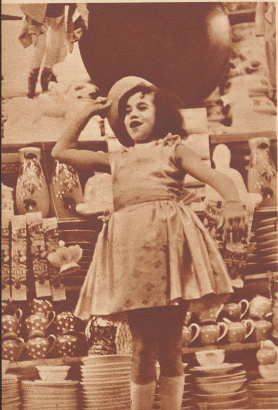
Eine neunjährige Französin, die von ihren Eltern dazu angehalten wird, durch ihre Rednergabe und ihr mimisches Talent Käufer anzuziehen.

In alten Kalendergeschichten steht jeweils zu lesen, daß frühreife Kinder und Wunderkinder nie alt würden, denn der kindliche Körper könne den Anforderungen des Geistes nicht genügen. Beispiele aus der Geschichte haben dieser Auffassung recht gegeben. Zu bedenken ist, daß vor Jahrhunderten, vor Jahrzehnten noch die Talente des geistig frühreifen Kindes forciert wurden. Waren die Eltern unbemittelt, so suchten sie eben daraus Kapital zu schlagen, was ihnen recht oft auf Kosten der geistigen und körperlichen Gesundheit des frühreifen Kindes gelang. Es gab ein Zeitalter, in dem Wunderkinder gezüchtet wurden — oft waren echte Genies darunter, man denke an den jungen Mozart und seine Schwester, an den Mathematiker Gauß, an die vielen Kinder, die als Sprach- oder Gedächtnisphänomene an den Höfen von Fürsten und Königen lebten, früh starben oder in Armut und Vergessenheit gerieten, wenn ihre armen, zerquälten Köpfe sich nicht immer wieder zu neuen übermäßigen Leistungen zwangen.