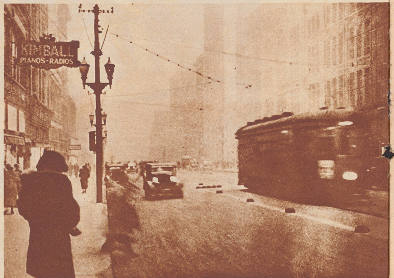
Blick in eine Straße von Kansas City während des Sandsturms. Es ist 11 Uhr vormittags. Wie dichter Nebel liegt der feine Staub in der Luft. Automobile und Straßenbahn verkehren mit Beleuchtung.

Der Sandsturm, der in den ersten Apriltagen über die mittelwestlichen Staaten von Amerika hinweggebraust ist, ist eine der schwersten Naturkatastrophen, die jemals U. S. A. betroffen hat. Das heimgesuchte Gebiet umfaßt acht Staaten: Nebraska, Colorado, Kansas, Oklahoma, Texas, Arkansas, Missouri und Mississippi. Der Sturm hatte seinen Ausgangspunkt in Colorado, pflanzte sich fort nach Osten und Süden. Auf den weiten durch mehrwöchige Regennot ausgedörrten Getreidefeldern, Weiden und Steppen wurden die oberen Humusschichten durch den viele Stunden lang dauernden Hurrikan buchstäblich weggesaugt und Hunderte von Kilometer weit weggetragen. In manchen Gebieten herrschte stundenlang eine richtige Weltuntergangsstimmung. Die Sonne war verdunkelt, der «trockene Regen» legte Bahn- und Luftverkehr lahm. In den Städten gingen die Menschen mit Gasmasken ausgerüstet auf die Straßen. Auf den Camps von Texas und Kansas gingen unzählige Weidetiere zugrunde.