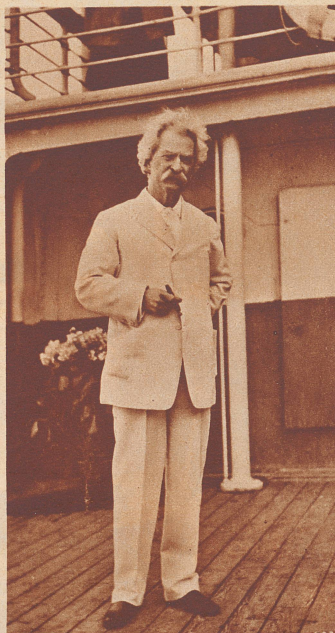
Mark Twain auf dem Dampfer «Minneapolis», der ihn nach Europa brachte. In seinen letzten Lebensjahren trug der Dichter meistens — auch an Land — einen weißen Flanellanzug.