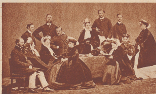
Ein Bild vom Dänischen Hof aus der Zeit kurz vor Ausbruch des Preussisch-Dänischen Krieges im Jahre 1864. Von links nach rechts: Kronprinz Christian, der spätere König Christian IX., von Dänemark, die spätere Königin von Dänemark, hinter ihr Prinz Wilhelm, Sohn Christian und spätere König von Griechenland, rechts von ihm der Kronprinz von Preußen, rechts außen im Vordergrund steht die Kronprinzessin von Preußen, hinter ihr Prinzessin Dänemark, die spätere Kaiserin von Rußland und Mutter des kaiserlichen Nikolaus II. Hinter dem Thron saßen die Prinzessinnen Alexandra und die Tochter Christian IX. Kurz nach ihrer Heirat mit dem preussischen Kaiser gab es einen Krieg zwischen Dänemark und Preußen, und der preussische Kronprinz marschierte als Kommandeur einer Armee gegen Dänemark.

Die erste Reihe der Kriege um Schleswig-Holstein fand im Jahre 1852 mit dem Londoner Vertrag ihren formalen Abschluß. In London wurde die Ausdehnung der weiblichen Erbfolge auf Schleswig-Holstein auch durch Preußen und Österreich anerkannt. Dänisch-schleswig-holsteinischer Thronfolger wurde demzufolge Prinz Christian aus dem Hause Glücksburg, der die erfolgreichste Kaiserin des Königs Friedrich VII. heiratete.