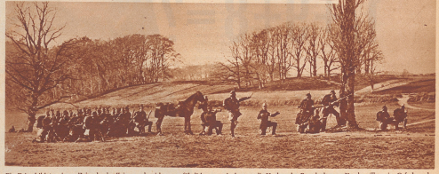
Ein Kriegsbild aus jener Zeit, da der Krieg noch nicht so gefährlich war wie heute: die Verluste des Brandenburger Jägerbataillons im Gefechtsfeld bei Osterlapp. Bezeichnend ist die Art der Truppenverteilung und die Art des Vorgehens dieser Vorkämpfer. Damals war es ungewöhnlich, so unpopulär und nicht aufzubrechen vorzuziehen. Es war kein Feuergefecht und keine Freigepäße im einem Schlachtgewehr zu befürchten.

lassen. Bedrängt von seinen eigenen Revolutionären, hatte er aber irgendeinen Erfolg überhaupt nötig und so ließ er in Ausführung eines Bundesbeschlusses den General Wrangel gegen die Dänen marschieren, der sie in mehreren Gefechten schlug. Vom Segensreich heimgekehrt, warf Papa Wrangel die 48er-Revolution Berlin wieder. Der Dänentag hat also seinen innerpolitischen Zweck erfüllt. Das Ende der deutschen Revolution hat auch der nationalen Bewegung der Elbherzogtümer das Rückgrat gebrochen. In Fortsetzung des Dänentages, im Jahre 1849, haben die Dänen den Preußen eine schwere Niederlage beigebracht, worauf die Preußen die ihnen so sehr unpopuläre schleswig-holsteinische Sache (Juli 1849) preisgaben.