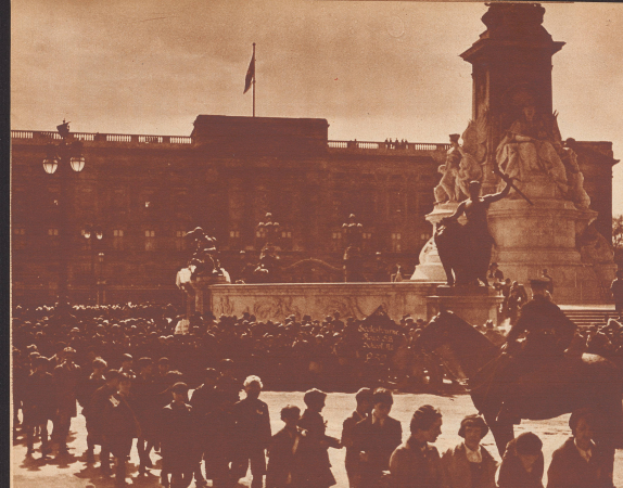
Der Aufmarsch der 70 000 Schulkinder aus den Vorstädten Londons vor dem Buckinghampalast, wo der König wohnte. Das größte Aufmarsch von so vielen jugendlichen Kindern war nicht leicht zu dirigieren. Das Eltern war zu verbieten, die Kinder zu begleiten. Dafür trug jedes Kind eine Nummer. Auf dem Nummernschild waren Name, Adresse, Schule und die nächste Untergrundbahnstation des Kindes angegeben. Um die Kinder zum Buckinghampalast zu bringen, wurden sie in ihren Wohngebieten an den Straßencken gesammelt. Wenn genügend beisammen waren, wurde der gesamte Verkehr gestoppt und der Palast führte die Kinder durch die freien Straßen. So kam es, daß bei diesem Empfang kein einziges Kind verunglückte.