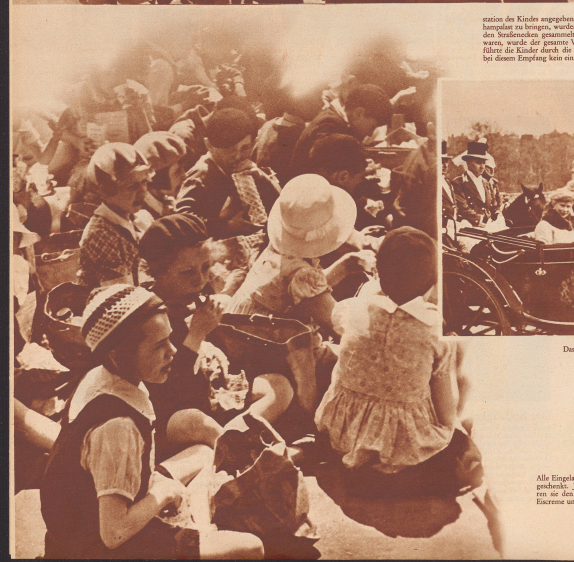
Der Königpaar fährt mitten durch die Kinderschar.