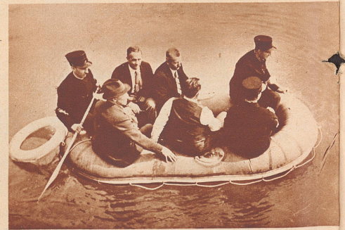
Die Feuerwehr mit dem Gummiboot. Als erste schweizerische Berufsfeuerwehr hat die Basler ständige Feuerwache zur Hilfeleistung bei Unglücksfällen im Schiffsverkehr oder an Badeorten Gummiboote und Taucherausrüstungen angeschafft. Ist die Rettungsmannschaft telephonisch alarmiert, so wird auf der Fahrt zur Unglücksstelle das Gummiboot aufgepumpt. Es vermag 10 Personen zu tragen. Bild: Das Polizeigummiboot bei einer Übungsfahrt auf dem Rhein.

Präsident der Tessiner Landwirtschaftskammer und Mitglied des Zentralvorstandes des Schweizerischen Bauernverbandes, starb 52 Jahre alt in Vacallo.