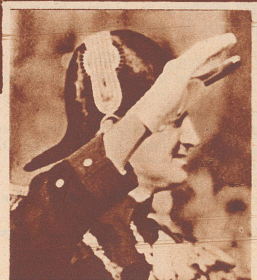
So sieht der Kronprinz Friedrich aus.

Der französische Flieger Delmotte gewann auf Caudron 460, ausgerüstet mit einem Motor von 330 PS, den ersten Preis im diesjährigen Schnelligkeitswettbewerb um den Coupe Deutsch de la Meurthe. Er legte die 2000-Kilometer-Strecke in 4:30,17 Stunden zurück. Sein Stundenmittel betrug 444 km. Bild: Unmittelbar nach dem Rennen wird Delmotte auf dem Flugfeld von Etampes von seiner Frau begrüßt.