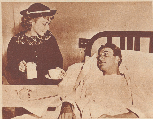
Jackie Coogan, einst als Kind im gleichnamigen Chaplin-Film der Liebling der Welt, hat einen schweren Autounfall gehabt, bei dem sein Vater das Leben verlor, und bei dem er selber verletzt wurde. Die kleine Filmdiva Anne Shirley ist sein häufigster Krankenbesuch.