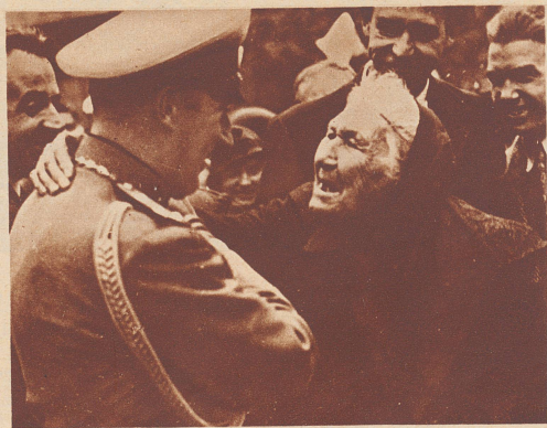
«Ach, so siehst du also aus», sagte die alte bulgarische Frau, als sie den König Boris bei einem Volksaufmarsch auf der Straße zu Gesicht bekam.