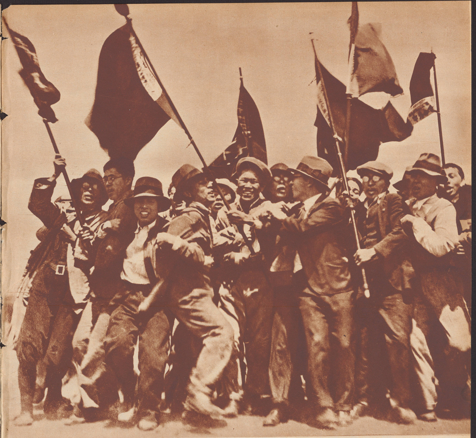
Japanische Arbeiter bei einer politischen Demonstration.