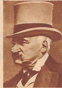
John Pierpont Morgan

Die Feinde Morgans haben andere Erklärungen zu geben. Morgan sei eben am Rande des Bankrottes, er mache Geld dort, wo er kann. Am einfachsten sei es, diese kleineren Objekte zu verkaufen, die immerhin pro Stück um verhältnismäßig erschwingliche Summen erworben werden können, so daß die Möglichkeit bestehe, eine Unzahl von Miniaturensammlern zum Zwecke der Sanierung des Hauses Morgan zu mobilisieren. — Eine andere, boshafere Erklärung sagt, er fürchte, daß im amerikanischen politischen Leben gewisse Wendungen