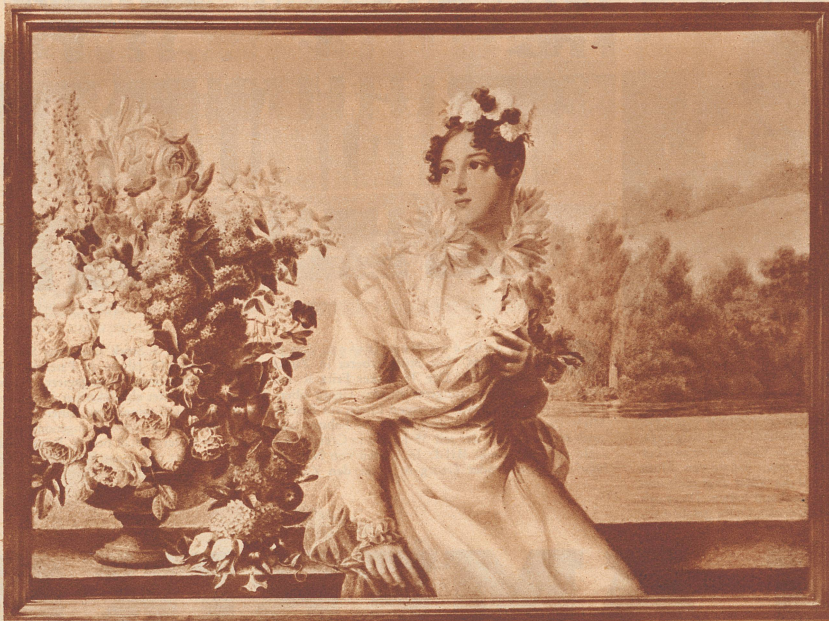
Aus der Sammlung Morgans: Porträt der Prinzessin de la Tremouille, gemalt ums Jahr 1835 von dem berühmten Miniaturmaler Isabey. Größe: 9\frac{1}{2} \times 12\frac{1}{2} Zoll, also ein verhältnismäßig großes Miniaturporträt.

eine höchst undurchsichtige finanzielle Lage hinterließ, und sein Sohn wäre gezwungen gewesen, sich Bargeld zu verschaffen, um das Bankhaus zu retten. Die Miniaturensammlung seines Vaters hatte er jedoch nicht aufgelöst. Im Gegenteil, es wurden immer wieder neue Stücke ihr hinzugefügt.