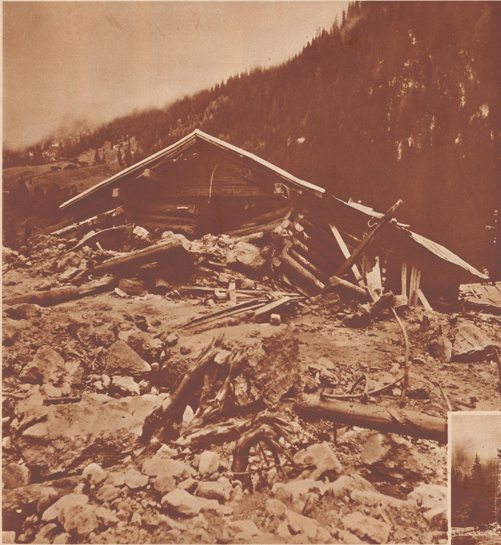
Das Chalet «Alpenrösli» nach der Katastrophe. Das Haus wurde von seinem ursprünglichen Standpunkt um mehrere Meter verschoben. Ganz aus den Fugen geraten, steht es meterhoch im Schlamm und Geschiebe.