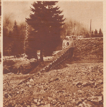
Auf eine Länge von 200 m hat das reißende Sturzwasser den Damm der Chur-Arosa-Bahn weggespült. Zwei Tage lang konnte der Verkehr nur durch Umsteigen aufrechterhalten werden.

Am 4. Juni ereignete sich beim Prätschsee oberhalb Arosa ein Dammbrech, der gewaltige Verheerungen im Gefolge hatte. Das Sturzwasser aus dem künstlich gestauten See drang in die Ortschaft Litzirüti ein, überdeckte den größten Teil der Matten mit Schutt und Schlamm, zerdrückte ein Wohnhaus und drei Ställe und richtete große Verwüstungen am Trasse der Chur-Arosa-Bahn und an der Autostraße nach Arosa an. Der Kulturschaden ist bedeutend. Menschen sind nicht umgekommen.