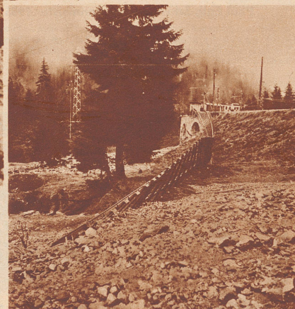
Auf eine Länge von 200 m hat das reißende Sturzwasser den Damm der Chur-Arosa-Bahn weggespült. Zwei Tage lang konnte der Verkehr nur durch Umsteigen aufrechterhalten werden.

Am 4. Juni ereignete sich beim Prätschsee oberhalb Arosa ein Dammbrech, der gewaltige Verheerungen im Gefolge hatte. Das Sturzwasser aus dem künstlich gestauten See drang in die Ortschaft Litzirüti ein, überdeckte den größten Teil der Matten mit Schutt und Schlamm, zerdrückte ein Wohnhaus und drei Ställe und richtete große Verwüstungen am Trasse der Chur-Arosa-Bahn und an der Autostraße nach Arosa an. Der Kulturschaden ist bedeutend. Menschen sind nicht umgekommen.