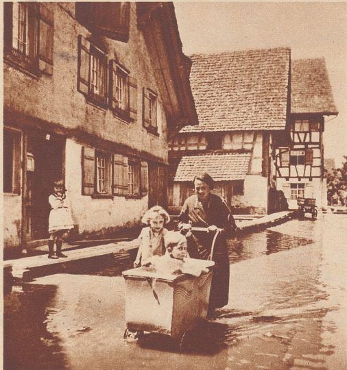
Spazierfahrt mit dem Kinderwagen durch die Hauptstraße von Ermatingen.