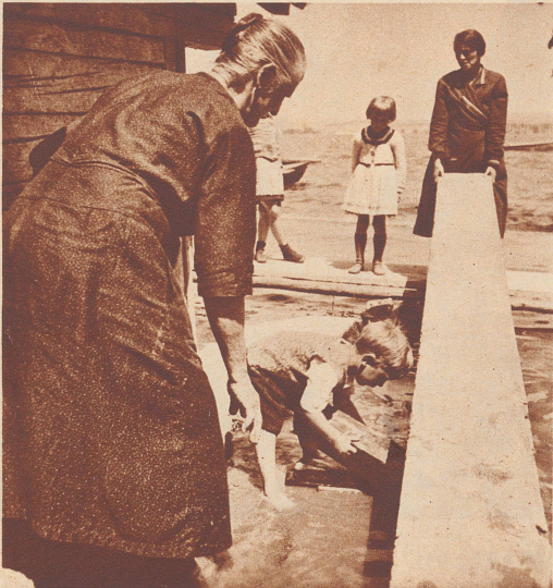
Notstegebau in einer Straße von Ermatingen.