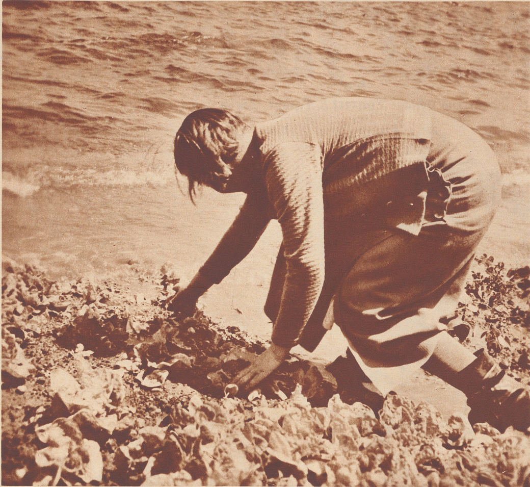
Wenn die Wasser steigen. Eine Fischersfrau in Ermatingen rettet die bedrohten Setzlinge aus dem Garten.